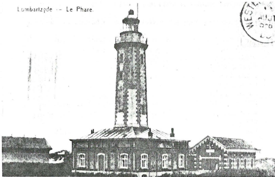
Lombartzjde -- Le Phare.

Uit deze foto blijkt duidelijk hoe toren en woonhuis voor 1914 één geheel vormden. Rechts bemerkt men de loods waar een reddingsboot stond. Het gebouwje links op de foto behoorde toe aan groot-grondbezitter Crombez, en deed dienst als opslagruimte-stalling.