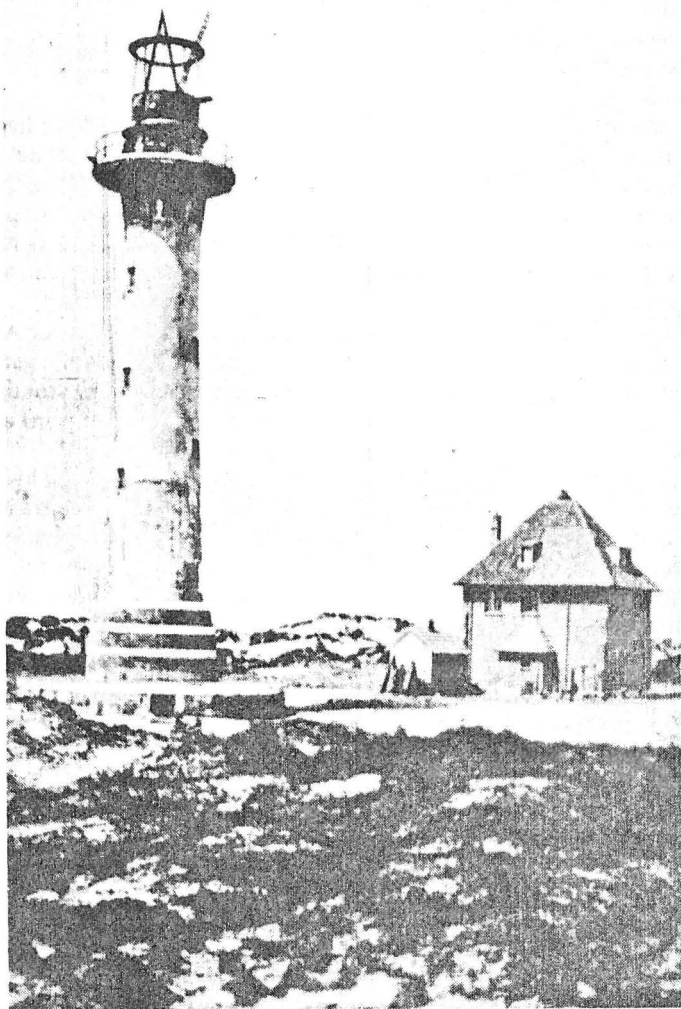
De toren in opbouw