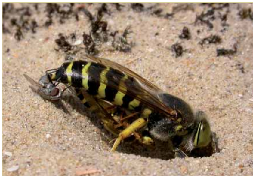
Figuur 1: Harkwesp met een zweefvlieg als prooi onder het lichaam. Achteraan het lichaam van de Harkwesp bevindt zich de parasitaire vleesvlieg Metopia leucocephala .

In onze kustduinen is natuurlijke zanddynamiek een essentiële component die verantwoordelijk is voor een landschapsvorming waarbij oude bodems overstoven worden door vers zand (Provoost 2004; Bonte & Provoost 2005). Hierdoor wordt op een natuurlijke wijze de vegetatiesuccessie naar verstruweling tegengegaan en kunnen pioniersvegetaties zoals mosduinen op een dynamische manier naast struwelen blijven bestaan. Door het gebrek aan bodemontwikkeling en de aanwezigheid van grote oppervlaktes kaal zand, heerst er een warm en droog microklimaat. Hierdoor worden mosduinen gekenmerkt door een specifieke flora en fauna die aangepast is aan natuurlijke verstoring, droogte en zeer hoge zomertemperaturen (Provoost & Bonte 2004). Uit recent onderzoek blijkt daarenboven dat deze soorten niet alleen zeldzaam zijn omwille van de zeldzaamheid van hun voorkeurs habitat, maar dat hun aanpassingen aan deze omstandigheden zich ook weerspiegelen in een lager voortplantingssucces en een verminderde mobiliteit in vergelijking met verwante soorten van meer gestabiliseerde duinvegetaties (Bonte et al. 2006). Een verlies aan natuurlijke zanddynamiek door het onderbreken van de natuurlijke