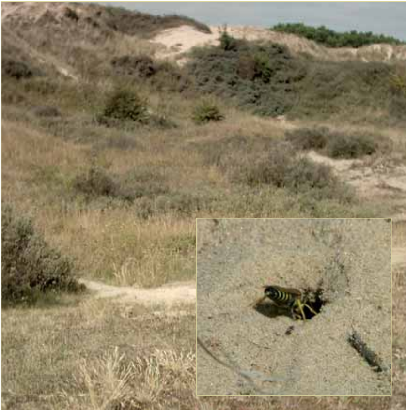
Figuur 2: Biotoop van de Harkwesp met in inzet een wijffe dat een nestholletje aan het graven is

tatievermogen, gebaseerd op zonkompas en de herkenning van structuren in het landschap, zorgen ervoor dat wijffes feilloos hun nesten terugvinden (Schöne & Tengo 1981; Schöne et al. 1993; Têngo et al. 1996).