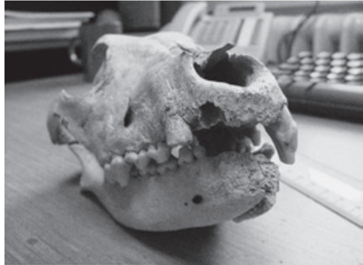
Schedel van een hond uit de Romeinse A303-vindplaats bij Stonehenge (UK). De snuit toont geheelde breuken en ernstig tandverlies, duidelijk het resultaat van geweld uitgeoefend op het dier

Domesticatie is een oud en geliefd thema binnen het archeologisch dierenonderzoek, misschien zelfs de eerste reden waarom dierenresten ooit uit opgravingen zijn bijgehouden. 30 Het proces toont zich in het geleidelijk of plots opduiken van voorheen 'wilde dieren' in menselijke woonplaatsen, in graduele of plotse veranderingen in de bouw van deze dieren, en in menselijke ingrepen die zichtbaar zijn – in vergelijking met wildpopulaties – als verschillen in de verdeling van sterfteleeftijden of de aantalsverhoudingen tussen de geslachten. Bovendien toont skeletmateriaal wanneer en waar voor het eerst aan selectieve rassenvorming werd gedaan. Voor Noordwest-Europa treedt bijvoorbeeld een