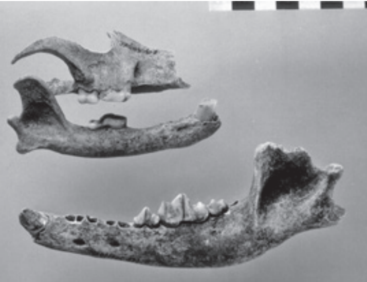
Schedelfragmenten van een kleine, oude hond uit Romeins Tongeren (België) (links boven) vergeleken met de onderkaak van een groter en jonger exemplaar (rechts beneden). De extreme tandslijtage en tandverlies suggereren dat het oude dier niet zonder menselijke zorg kon overleven