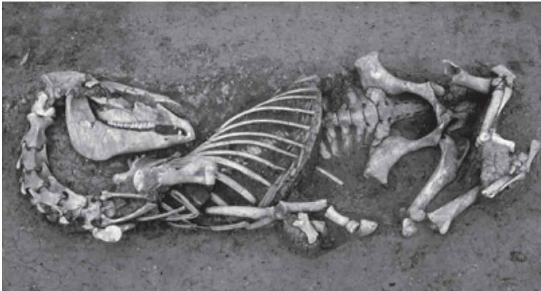
Dit paard heeft in het 15de-eeuwse vissersdorp te Raversijde (Oostende, België) een eenvoudig graf gekregen. Het kadaver is niet gevild en niet van het vlees ontdaan