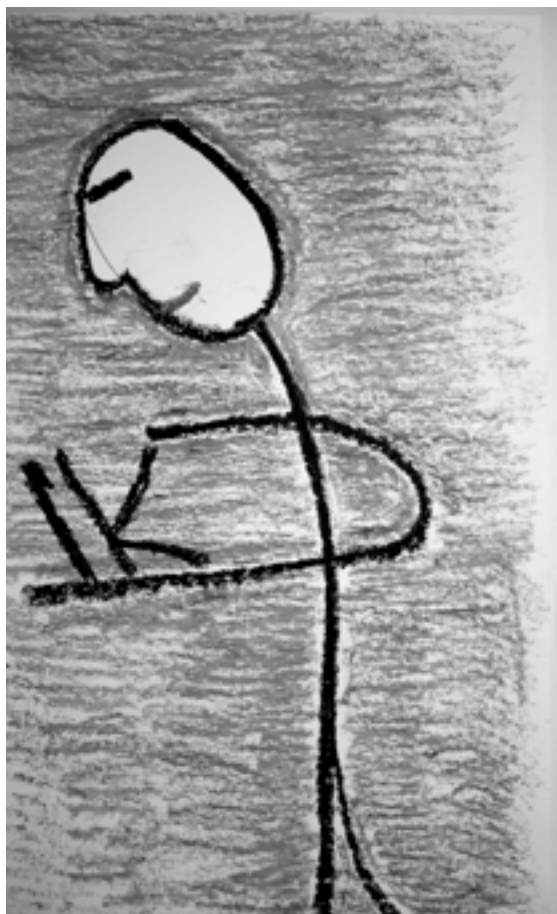
Afbeelding 1 Symbool van kracht

Bij zowel Frits als Jaap zien we dat verhalen vanaf hun jeugd een rol spelen bij hun strijd tegen de ervaring van machteloosheid. Ze blijken mannelijke helden nodig te hebben om zin te geven aan hun strijd om te overleven. Jaap trok zich op aan ridderfiguren, die strijden tegen onrecht. Frits gaf zijn leven en lijden betekenis vanuit bijbelverhalen. Ook geven ze beiden aan in hun volwassen leven een bewuste keuze gemaakt te hebben voor positieve waarden om voor te leven. Dat lukt alleen als ze de innerlijke demonen, die ze vanuit het misbruik in zich meedragen, onder ogen kunnen zien. Deze voorbeelden tonen hoe bij de transformatie van mannelijkheidsbeelden betekenisgeving