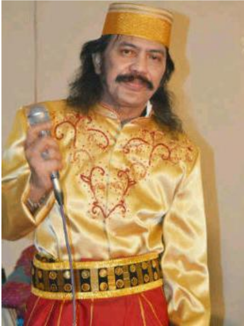
Foto Iwan Tompo sebagai penyanyi dan pencipta lagu populer Makassar