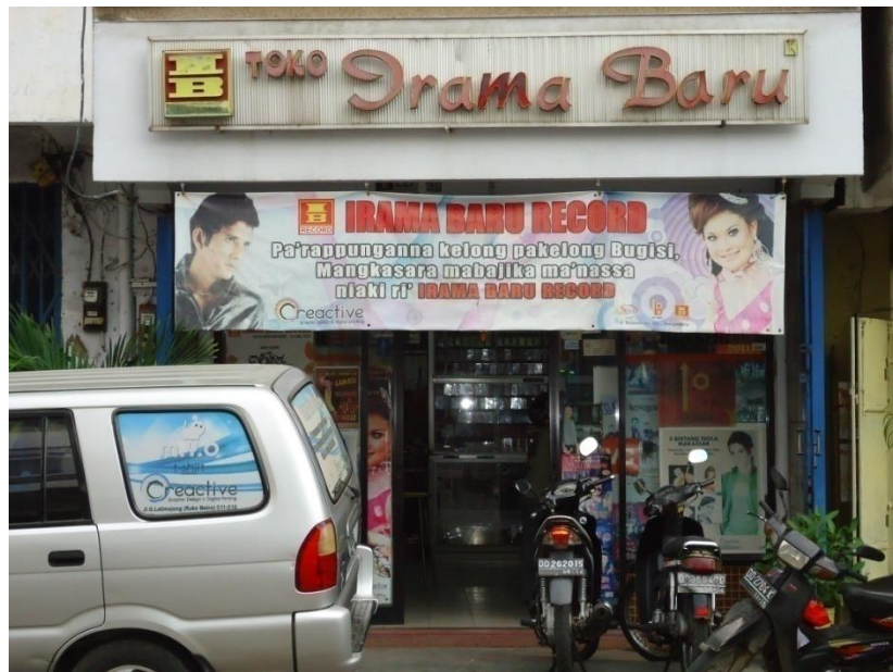
gambar 1 Toko Irama Baru Record (Dokumentasi Penulis, tanggal 12 Desember 2011)

fungsi yang berbeda namun tetap mempunyai tujuan kerja yang sama. Untuk tempat perekaman musik dan vokal pada irama baru record ini terletak di jalan Petta Punggawa no. 19 A Makassar, Indonesia. Sedangkan kantor Irama Baru Record sekaligus yang merupakan tempat penjualan kaset dan CD tertletak di jalan Sulawesi no 231 makassar.