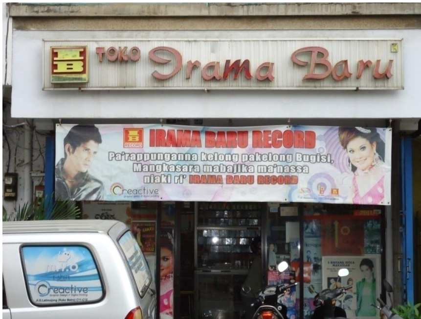
Foto lokasi toko Irama Baru Record