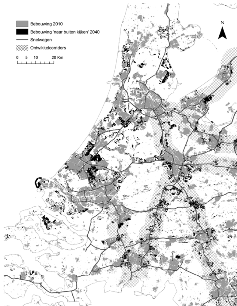
FIGUUR 3. VERBEELDING NIEUWE VERSTEDELIJKING IN HET 'NAAR BUITEN KIJKEN' CONCEPT .

De kaarten die het snelwegcorridor concept verbeeldden, vielen bij VROM het meest in de smaak. Deze beelden lieten sterk geconcentreerde verstedelijking zien binnen snelwegcorridors rond de Randstad. De aannames achter dit 'naar buiten kijken' concept zijn in de verbeelding benadrukt (zie de 'ontwikkelcorridors' in Figuur 3). Deze kaart, waarin het achterliggende planconcept wordt verbonden met de verbeelde concepten, bleek veelzeggender dan gebruikelijke ruimtegebruikskaarten. Sterker nog, de gedetailleerde weergave van verstedelijking in deze kaarten riep meer vragen op (waarom hier? houd je wel rekening met zus? kan het niet zo?) dan zij beantwoordde. Met name in strategische planvormingsprocessen is het kiezen van een visualisatievorm die recht doet aan de aannames en onzekerheden die achter de kaartbeelden liggen een grote uitdaging.