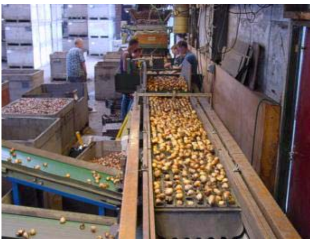
Figuur 2. Sorteermachine.

Dat scholen ook worden ingezet om kinderen van de straat te houden (de bewaarfunctie ) ligt bij velen minder voor op de tong. Toch lopen de gemoederen hoog op als een school de 'urennorm' niet haalt. De school moet niet alleen bepaalde leerprestaties behalen, maar er ook voor zorgen dat kinderen niet te veel rondzwerven op straat.