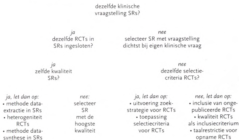
Figuur 4.10 Algoritme voor het kiezen van de best passende systematische review(s) (SR('s)) wanneer er over hetzelfde onderwerp systematische reviews met tegenstrijdige conclusies beschikbaar zijn (bron: Jadad e.a., 1997).

Het is bij tegenstrijdige systematische reviews over hetzelfde onderwerp allereerst belangrijk om te kijken welke systematische review een vraagstelling heeft die het dichtst bij de klinische vraag staat. Indien dezelfde RCTs in de verschillende systematische reviews zijn ingesloten, kan men zich richten op de methodologisch beste systematische review. Indien er geen verschil in kwaliteit is, zal de lezer een nauwkeurige analyse moeten maken van de manier waarop de gegevens zijn geëxtraheerd (bijv. door twee reviewers onafhankelijk van elkaar), hoe met heterogeniteit is omgegaan en of op de uitkomsten op de juiste manier zijn gepoold. Indien niet dezelfde RCTs zijn ingesloten, dan moet allereerst worden beoordeeld of bij dezelfde vraagstelling wel dezelfde selectiecriteria voor onderzoeken zijn gehanteerd.