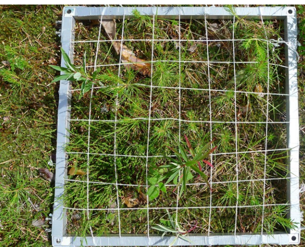
Figur 2. Bratt forsøksfelt der det både er lagt på organisk matte og tilført jord. Etter sju år er det etablert et kraftig vegetasjonsdekke med mange arter.

Tilførsel av næring kan gi raskere etablering av vegetasjonsdekke, noe som kan være nødvendig dersom man ønsker å begrense erosjon. Forskjellen i vegetasjonsdekning mellom alginat- og gjødselrutene er endret over tid (ANOVA: F=8,737 ; p=0,003 ). I 2010 var det litt høyere dekning i alginatrutene (men ikke signifikant; t -test: t=1,583 ; p=0,116 ), mens i 2014 var det en signifikant høyere dekning i gjødselbehandlingene ( t -test: t=-2,620 ; p=0,01 ). Dette gjelder for både moderat og kraftig slitte områder. Det ser dermed ut til at gjødsel gir større dekning enn alginat på lang sikt.