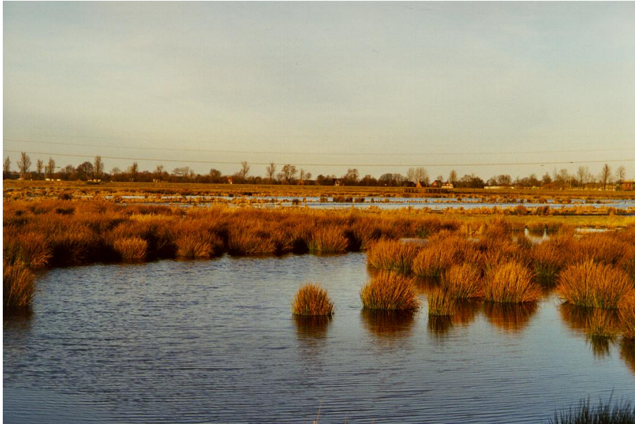
Figuur 3.3 Een voormalig landbouwgebied (niet in Noord Holland) dat geïnundeerd is.

Dynamisch moeras. Deze vorm is te realiseren in het meest waterrijke gebied. Er doen zich waterstanden in de winter voor tot 40 cm boven maaiveld (inundatie), met aan het einde van de zomer plas/dras-situaties. Er zijn minimale perspectieven voor de landbouw: wel natuurlandbouw en historisch/veenweidebeheer, en op een aantal plaatsen met diepere grondwaterstanden moderne veehouderij. Er komen verschillende natuurdoeltypen van het laagveengebied voor: open water, rietland, ruigten, struwelen, broekbossen. Afhankelijk van (maai) beheer eventueel natte graslanden. Het gebied waar laag water gerealiseerd wordt voor bebouwing is circa 10% (zie IWACO 2000, p. 31).