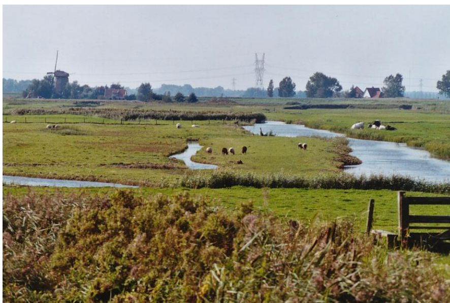
Figuur 3.2 Een typisch 'Historisch' veenweidelandschap.