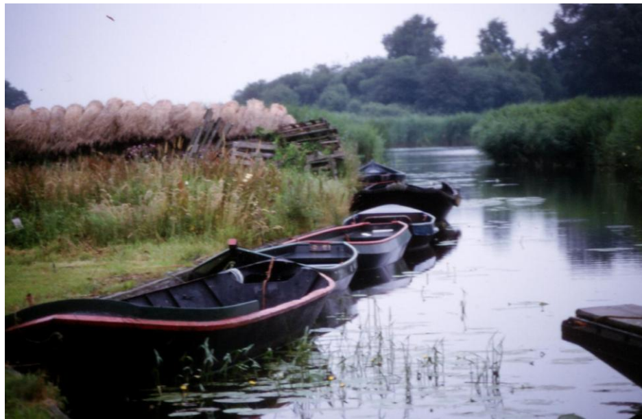
Figuur 3.4 In moerasgebieden kan energieteelt plaatsvinden maar ook worden gerecreëerd.

Alle vier de beheersvormen zijn ingezet vanuit een waterdimensie en kunnen, afhankelijk van de keuzes in waterbeheer, in verschillende ruimtelijke verdelingen en stadia voorkomen in het veenweidegebied. Deze beheersalternatieven worden in de navolgende hoofdstukken nader uitgewerkt.