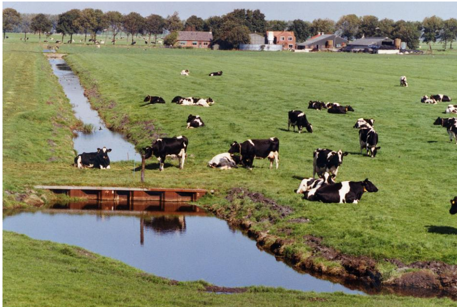
Figuur 3.1 Een typisch 'Modern' veenweidelandschap.