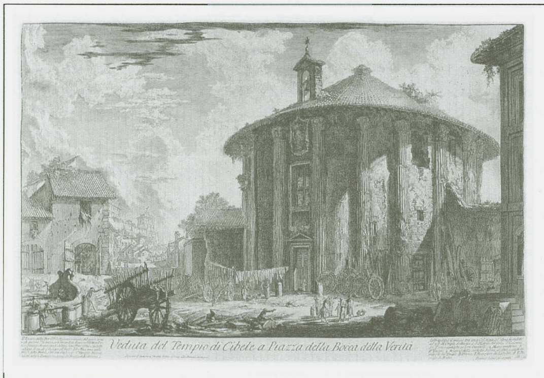
Piranesi, Veduta del Tempio di Cibele

Husly was waarschijnlijk ook bekend met de Romeinse ronde tempels van Hercules Invictus/Victor en Vesta in Rome en Tivoli, die in ruïneuze staat altijd zichtbaar waren gebleven en sinds de zestiende eeuw regelmatig werden gereconstrueerd in prenten en architectuurboeken. Zijn bibliotheek bevatte onder meer de studies van Pietro Santi Bartoli over Romeinse mausolea ‘met verscheide geschreeven Anotatien’ en Jean Barbault’s Les plus beaux monuments de Rome ancienne (1761) in 128 platen. 19 Onzeker is of hij ook D. Rossi’s Romanæ magnitudinis monumenta (1699) kende, dat in de reconstructie