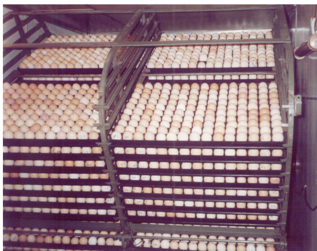
Figura 3 – Estocagem de ovos no incubatório.