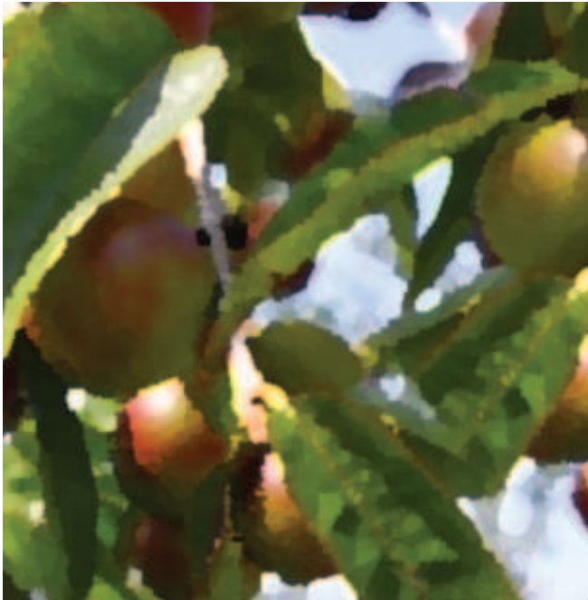
Ilustração: Marcos Moulin