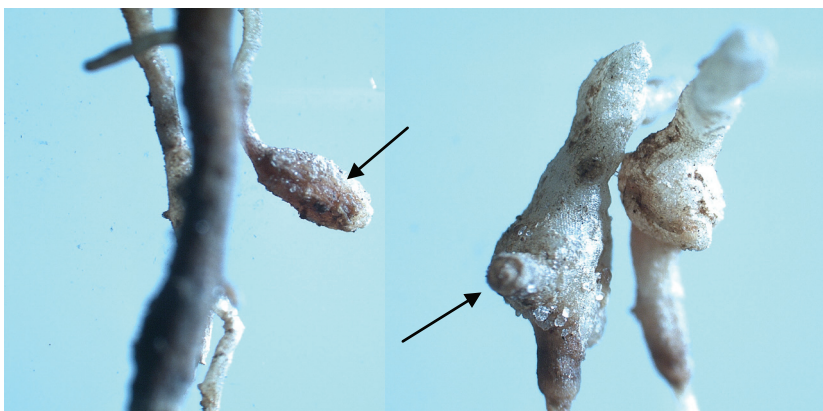
Figura 2. Raízes de cana-de-açúcar com galhas causadas por Meloidogyne javanica .