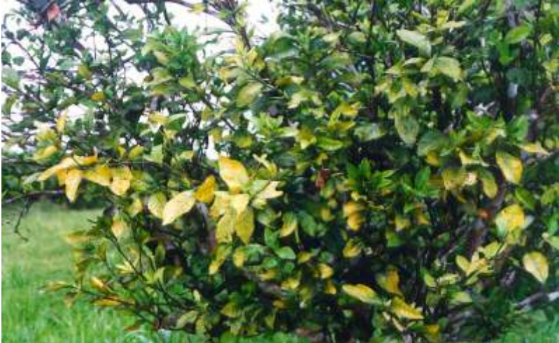
FIG. 1. Deficiência de nitrogênio.

Segundo Anderson (1993), o biureto, impureza presente na uréia, pode provocar clorose, especialmente no ápice das folhas jovens dos citros que receberam aplicações indiscriminadas de uréia via solo ou aspersão foliar.