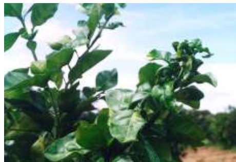
FIG. 8. Deficiência de boro no fruto. FIG. 9. Deficiência de boro em folhas.