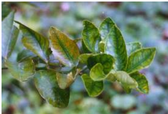
FIG. 12. Deficiência de manganês.

Os sintomas de deficiência de manganês ocorrem nas folhas novas, cujo tamanho praticamente permanece normal, com a perda de brilho e clorose entre as nervuras que permanecem verdes (Rodríguez, 1991; Du Plessis, 1992; Anderson, 1993; Malavolta et al., 1997) (Fig. 12). Quando os sintomas de deficiência são moderados, tendem a desaparecer em poucas semanas, quando a folha atinge o tamanho normal (Anderson, 1993). No Amazonas é comum encontrar plantios apresentando sintomas de carência deste nutriente, provavelmente pelo uso indiscriminado de corretivos de acidez do solo e de adubação pesada com fontes de fósforo, cobre e zinco, sendo mais comum o aparecimento dos sintomas no período menos chuvoso.