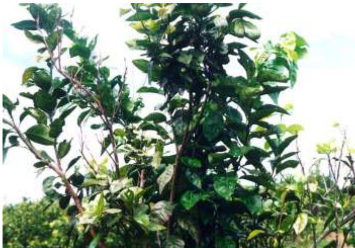
FIG. 10. Deficiência de cobre.

o s d a n o s c a u s a d o s à s r a í z e s d o s c i t r o s p o r t o x i c i d a d e d e c o b r e s ã o s e m e l h a n t e s à s i n j ú r i a s c a u s a d a s p o r n e m a t ó i d e s q u e p r o v o c a m d e f o r m a ç ã o e e s c u r e c i m e n t o d e s s e ó r g ã o c o m o u m t o d o .