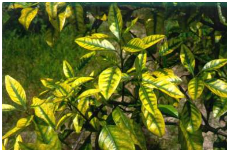
FIG. 13. Deficiência de zinco.

Não se registra, na literatura, a ocorrência de excesso de Zn limitando a citricultura.