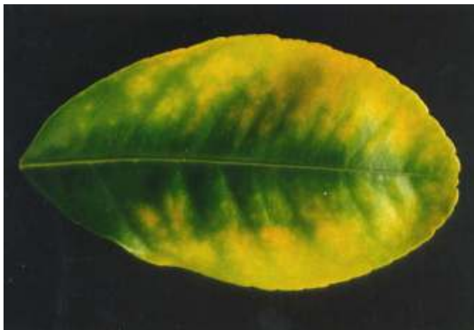
FIG. 5. Deficiência de cálcio.

Rosseti (1980) relaciona o definhamento dos citros na região de Araraquara a uma deficiência de cálcio no solo, já que em solos de cerrado, muito ácidos, a calagem tem sido benéfica no controle dessa doença, de causa não determinada. Na Fig. 5 é apresentado folha de laranjeira com sintoma de carência de cálcio.