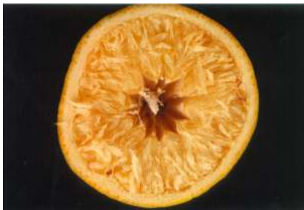
FIG. 3. Deficiência de fósforo.

Não são conhecidos, na literatura, casos de toxidez de fósforo, mas o excesso pode induzir a carência de cobre, reduzir a absorção de boro e zinco e aumentar a absorção de magnésio e manganês (Rodriguez, 1991).