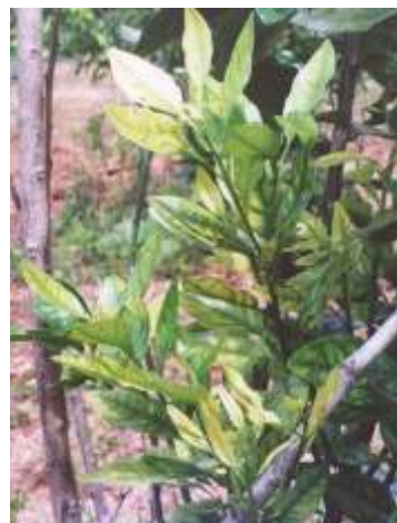
FIG. 11. Deficiência de ferro.

Os citros com deficiência de ferro apresentam folhas novas delgadas, cloróticas e com nervura verde. Nos casos de deficiência aguda, toda a folha torna-se amarela, com áreas necróticas; há queda das folhas da extremidade dos ramos, acompanhada de morte descendente (Fig. 11). Devido à imobilidade na planta, a deficiência de ferro aparece primeiro nas folhas novas. Malavolta & Kilemann (1985) e Rodriguez (1991) consideram que a ocorrência de deficiência de ferro nas plantas cítricas não se constitui em problema para os pomares brasileiros. Não há registro na literatura sobre problemas de excesso de ferro limitando a citricultura.