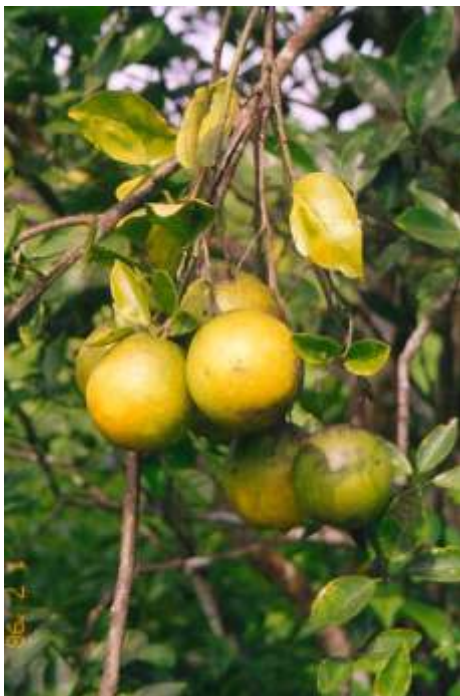
FIG. 7. Deficiência de enxofre.

As folhas novas com carência de enxofre são pequenas e de coloração verde-amarelada e amarela (Malavolta & Kliemann, 1985). Não têm sido observados casos de deficiência de enxofre em citros no campo, talvez porque o enxofre seja aplicado regularmente, na maioria dos pomares, sob a forma de sulfatos de Cu, Mn e Zn, além de superfosfato simples e sulfato de amônio e de potássio. Anderson (1993) cita que o excesso de enxofre resulta em injúrias na casca do fruto, semelhante a uma forte queimadura de sol. Na Fig. 7 pode-se observar sintoma de carência de enxofre nas laranjeiras cultivadas no Município de Manaus-AM.