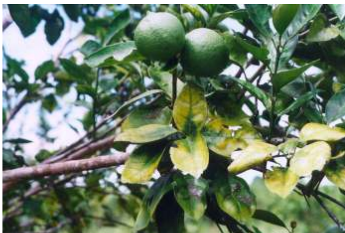
FIG. 6. Deficiência de magnésio.

Os sintomas de deficiência de magnésio se manifestam nas folhas maduras, através de áreas cloróticas internervais ao longo da nervura principal (Malavolta & Kliemann, 1985). Em estágios avançados, toda a folha pode se tornar clorótica, permanecendo verde uma pequena área próxima ao pecíolo (Fig. 6). O magnésio migra das folhas mais velhas para os frutos e, na falta do elemento, aparecem cloroses entre as nervuras e nos lados da nervura principal das folhas, com o remanescente da clorofila formando um "V" verde invertido em relação ao pecíolo (Rodriguez, 1991). Em casos de extrema deficiência, há desfolhamento e pode ocorrer secamento de ramos. Os autores chamam atenção de que as variedades com sementes e os ramos com mais frutos apresentam mais sintomas de falta de magnésio e que, uma vez corrigida a deficiência, com adições extras do elemento, as folhas afetadas não recuperam o verde e há pouca influência no aumento da produção. Du Plessis (1992) enfatiza a constância de sintomas de deficiência de magnésio em citros cultivados em solos lixiviados e ácidos. Anderson (1993) complementa que em solos arenosos os sintomas aparecem com maior frequência e que os programas de adubação devem ser bem planejados, para compensar a baixa retenção. Não há registro dos efeitos de excesso de magnésio sobre plantas cítricas.