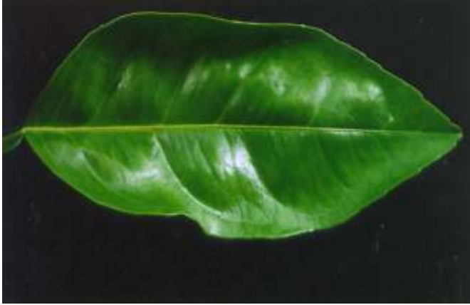
FIG. 2. Excesso de nitrogênio.