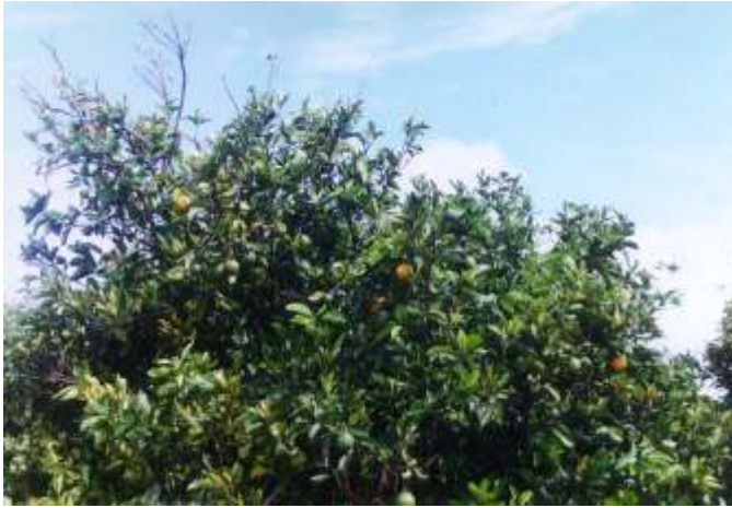
FIG. 4. Deficiência de potássio.

destaca o efeito do potássio no pegamento dos frutos e seu crescimento. Na Fig. 4 é apresentada folha de laranjeira em produção com sintomas de deficiência de K.