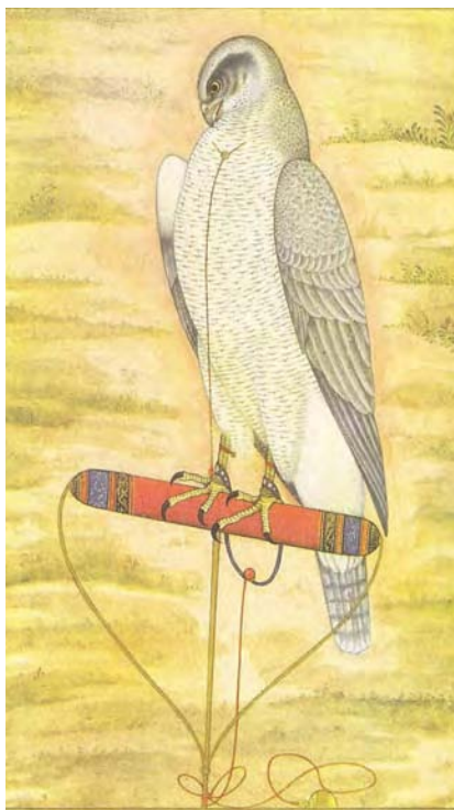
Miniatura índia de falconeria, Astor ( Accipiter gentilis ).

Davant la situació exposada el governador mana fer una crida pública prohibint la captura de perdius amb caldera i filats, sots pena de 25 lliures i de perdre els estris. (Cateura 1981: 256-257; Rosselló & Albertí 2003: 208).