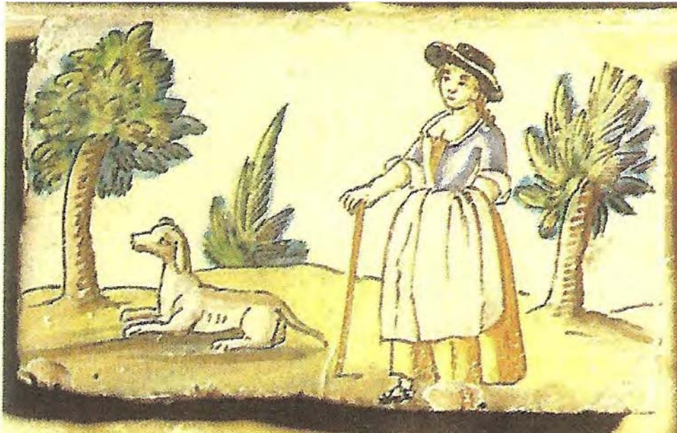
Rajoles polícromes a Mallorca amb una pagesa amb un ca. Rajoles de Manises, segle XVIII (Cabot i Mulet, 1990).

Crida manant denunciar tots els cans podencs.