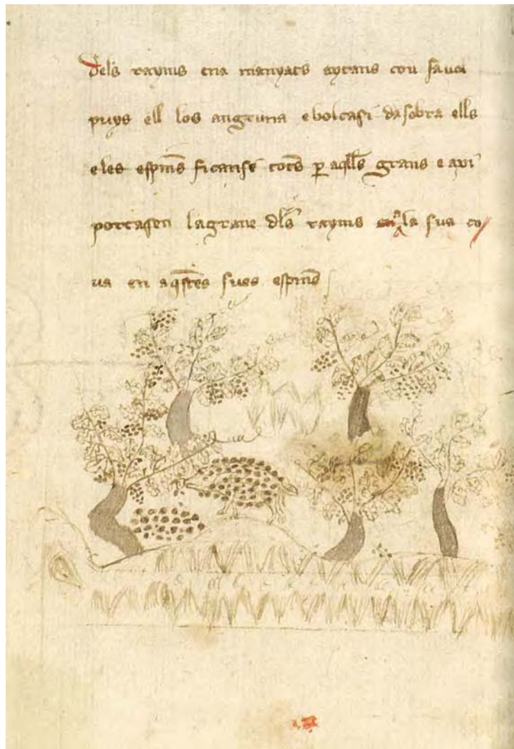
Escena de l'eriçó del Bestiari català manuscript 310 de la Biblioteca de Catalunya, que descriu el transport de grans de raïm clavats a les seves espines.