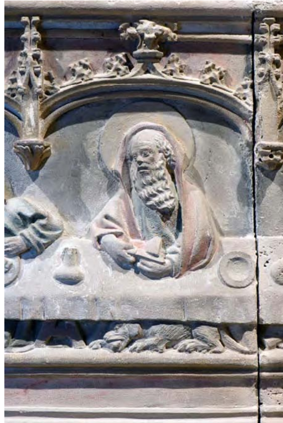
Detall de l'apòstol a la taula i el ca del retaule del Santuari de Sant Salvador (Felanitx).