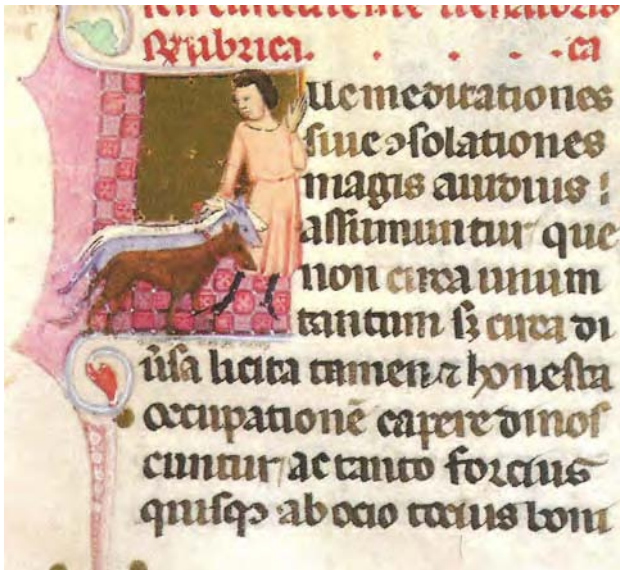
Reproducció de les figures de les Lleis Palatines (esquerra). Dreta, representació de les imatges de les Lleis Palatines en que es representen els oficis, en aquest cas del cuidador dels cans o caners (dreta).