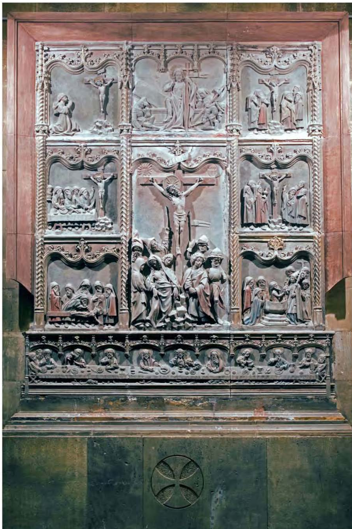
Imatge completa del retaule del Santuari de Sant Salvador (Felanitx). A la iconografia inferior, imatge del Sant Sopar a on són figurats un ca i un moix (vegeu portada del llibre i veureu el ca en detall).