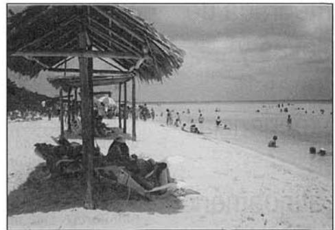
Fig. 1. Playa de Varadero, Cuba. Fig. 1. Varadero Beach, Cuba.

Evidentemente, el desarrollo turístico se lleva a cabo mediante acciones sobre la costa, las cuales demandan grandes inversiones económicas. Razón por la cual