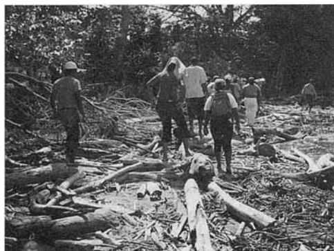
Fig. 6. Caminata de reconocimiento Punta Piedra, Colombia.

Fig. 6. Reconnaissance trek Punta Piedra, Colombia.