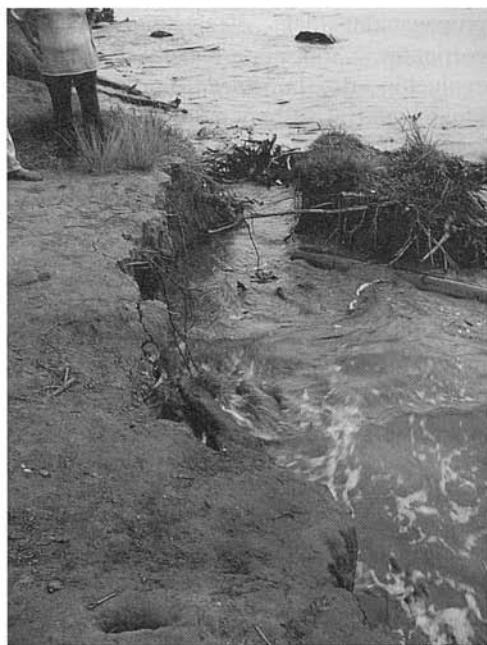
Fig. 7. Erosión costera fuerte, Punta Piedra, Colombia.

La capacitación se dirigió a dos grupos de trabajo, uno de la zona rural y