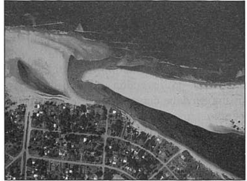
Fig. 3. Foto aérea de San José, Uruguay. Fig. 3. Aerial photo of San José, Uruguay.

Desafortunadamente todavía faltan estándares internacionales reconocidas para el monitoreo de las playas, aunque para algunos parámetros (como los arrecifes) ya se encuentren metodologías recomendadas al nivel internacional y regional. Entre los objetivos de la Red ProPlayas, una red regional de expertos en el manejo de playas en el Caribe y Suramérica, es proveer a la comunidad interesada un inventario de metodologías y herramientas genéricas para el monitoreo integrado de las playas.