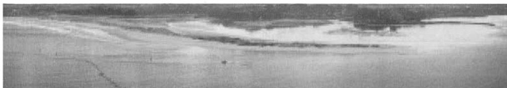
Fig. 4. Vista panorámica desde cuatro cámaras mezcladas. Fig. 4. Panoramic view mixed from four cameras.

Como han evidenciado algunos autores, el uso del vídeo y el procesamiento de imágenes, permite estudiar problemas concretos de ingeniería de costas. La fiabili-