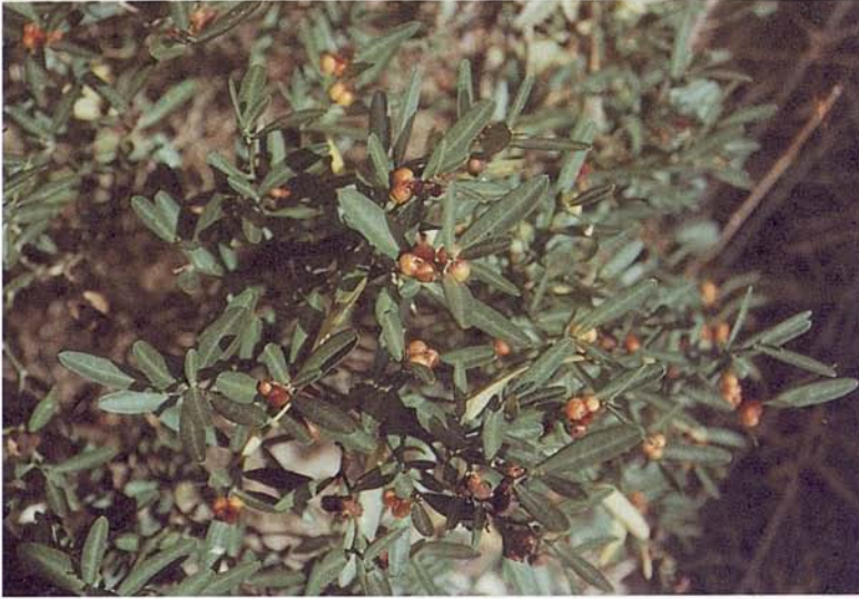
Figura 2. Olivella ( Cneorum tricoccon ) amb fruits madurs que són consumits per sargantanes i marts a les illes Balears.

Figure 2. Cneorum tricoccon mature fruits that are consumed by lizards and pine martens in the Balearic Islands.