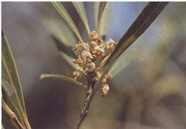
Figura 4. Flors d'aladern de fulla estreta ( Phillyrea angustifolia ) de l'illa de Mallorca. Mentre que a la Península Ibèrica l'androdioècia és només morfològica, a les illes Balears és també funcional.

Figure 4. Flowers of Phillyrea angustifolia from Mallorca. In the Iberian Peninsula the androdioecy of this plant is only morphological, but in the Balearic Islands is also functional.