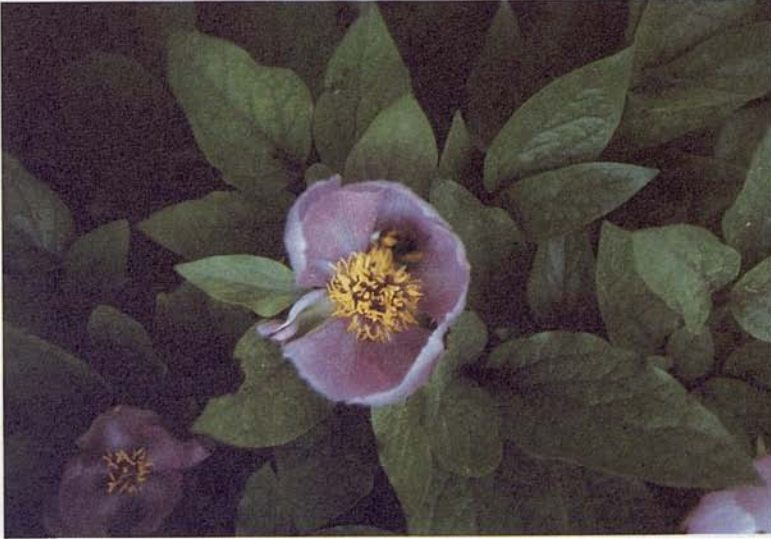
Figura 3. Pol·linitzador de Paeonia cambessedessi al Jardí Botànic de Sòller (Mallorca). A les illes, les peònies semblen tenir un grau d'autogàmia més elevat que al continent.

Figure 3. Pollinator of Paeonia cambessedessi in the Botanical Garden of Sòller (Mallorca). On islands, the paeonias appear to have higher rates of autogamy than on mainland.