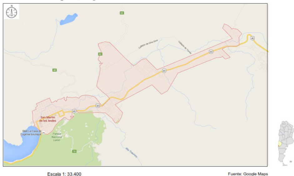
Figura 3. “La expansión urbana de San Martín de los Andes, Provincia de Neuquén, Argentina”

espacio se homogeneiza, se fragmenta y se jerarquiza según los intereses de las elites.