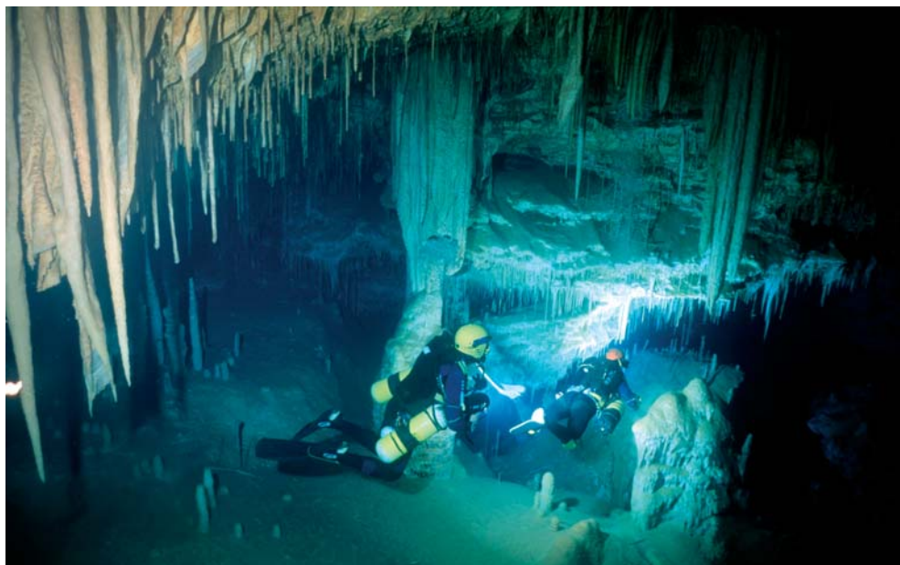
Figura 4. Exploración de cavidades litorales sumergidas en el litoral oriental de Mallorca por parte de espeleólogos de la Federació Balear d'Espeleologia.