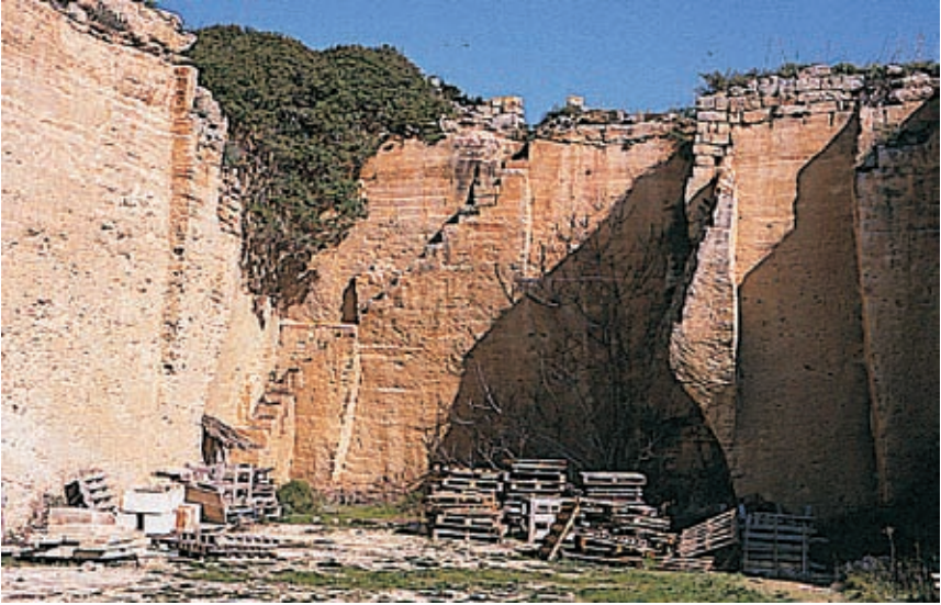
Figura 2 Aspecto general de la cantera de marès poco después del abandono de su explotación

Aunque extendidas por todo el Migjorn de Menorca, el área de Ciutadella, Alaior, Ferreries y la zona oriental con Maó y Es Castell, concentran la mayor parte de las canteras.