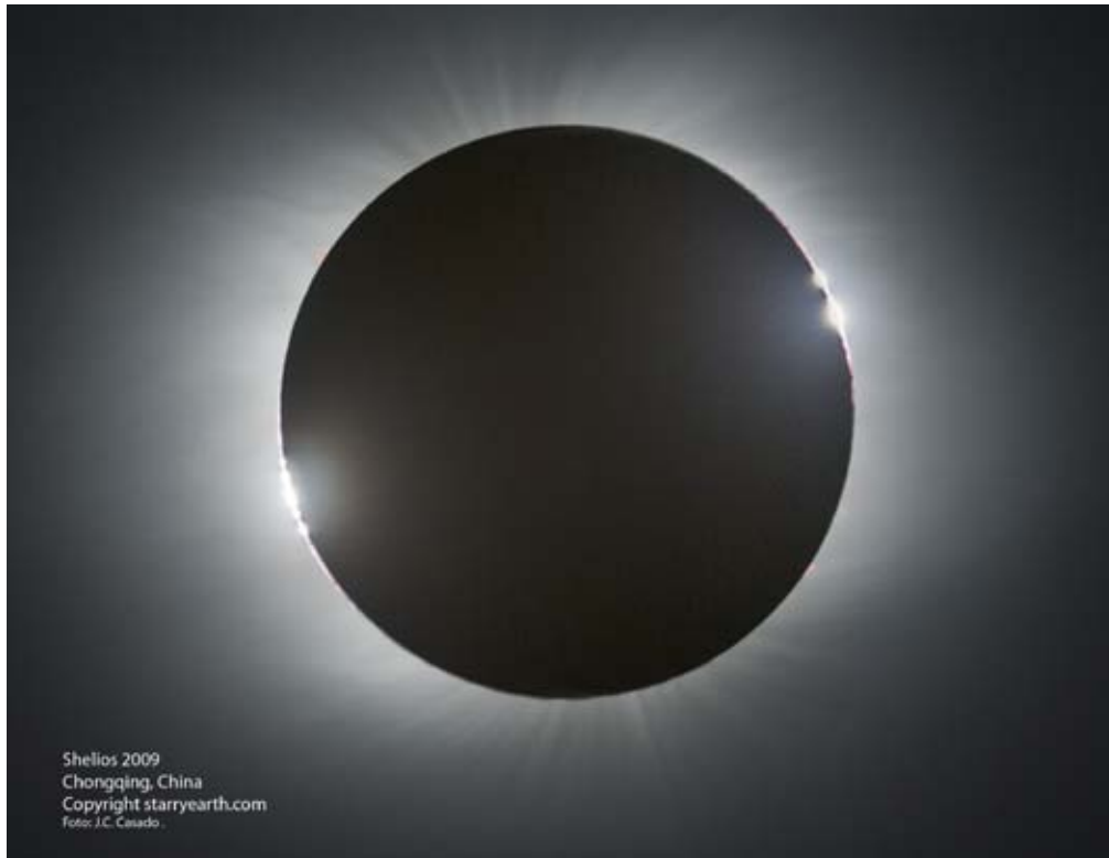
Figura 6: Corona solar del eclipse total de Sol del 1 de Agosto de 2008 desde el mar Ob (Novosibirsk, Rusia). Combinación digital de 67 imágenes que muestra largas extensiones de la corona, protuberancias, luz cenicienta y estrellas hasta la magnitud 10.

Para el eclipse total de Sol del año 2006, Shelios organizó una expedición al Desierto de Libia, Shelios'08, que desplazó a un grupo de 40 personas a la ciudad rusa de Novosibirsk para realizar observaciones del eclipse total de Sol que tuvo lugar el 1 de agosto de 2008. Gracias a las buenas condiciones meteorológicas se obtuvieron detalles de la corona y de la cromosfera solar nunca antes observadas (Fig. 6). El último eclipse observado es el que se produjo el pasado 22 de julio de 2009. Shelios se desplazó hasta las cercanías de la ciudad china de Chongqing para obtener imágenes de la totalidad (Fig. 7).