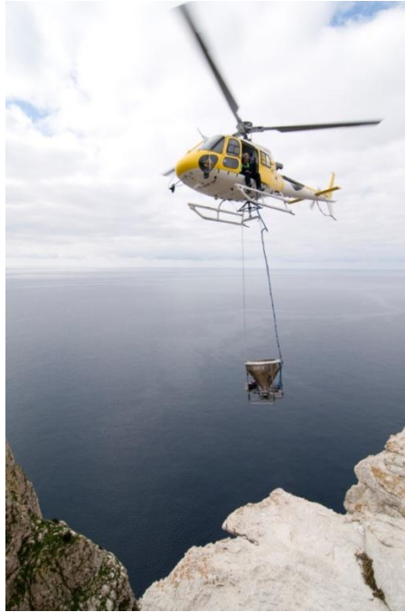
Foto: Sa Dragonera va ser desratitzada el 2013, amb les tècniques més modernes disponibles, i ha estat un dels projectes més emblemàtics del servei en els darrers anys. La resposta de la població de virot petit a l'illa va ser immediata, amb èxit reproductor a nius que eren inviables per la presència de rosegadors.