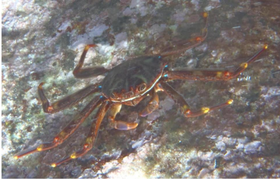
Fig. 3. Exemplar de Percnon gibbesi a la costa de Porto Cristo..

A l'hora d'analitzar la seva entrada a la Mar Mediterrània, la principal hipòtesi és que va entrar a través de l'Estret de Gibraltar i una explicació de l'alt èxit de colonització d'aquest decàpode pot atribuir-se a la dispersió de les fases larvàries, tant pels règims de corrents dominants com per vectors antròpics com podrien esser el desplaçament per aigües de llast amb el tràfic marítim, així com l'aqüicultura.