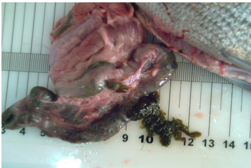
Fig. 2. Detall del contingut estomacal d'un exemplar de Spondyliosoma cantharus capturat a la Badia de Palma.