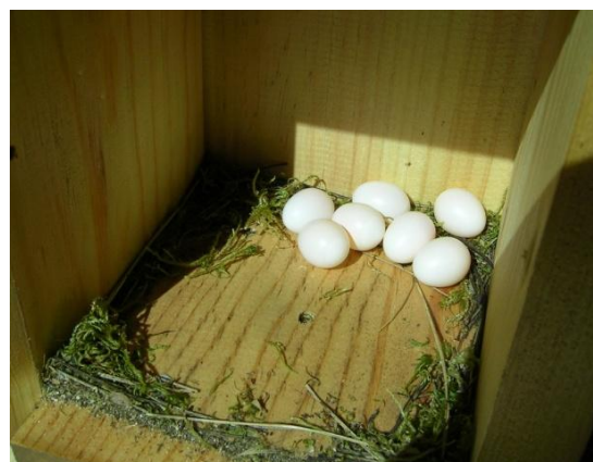
Foto 6.- Posta de formiguer ( Jynx torquilla ) en niu robat als ferrerics. Son Real, 31/05/2010.