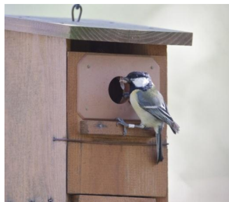
Foto 2.- Mascle de ferrerico ( Parus major ) amb aliment per als polls. Son Real, 20/05/2010.