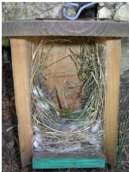
Foto 8.- Niu de gorrió ( Passer domesticus ) a mig fer. Parc de Llevant, 12/04/2011.