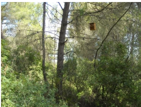
Foto 1.- Niu ocupat per ferrerico ( Parus major ) a Son Real, 04/2009.