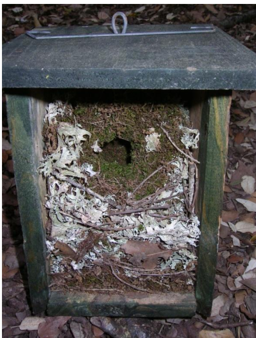
Foto 7.- Niu de passaforadí ( Troglodytes troglodytes ). Defla, 21/04/2011.