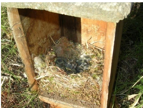
Foto 5.- Niu amb 6 polls de ferrerico blau ( Cyanistes caeruleus ) d'uns 12 dies. Na Burguesa, 29/05/2012.