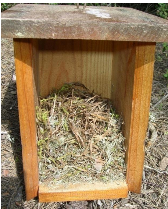
Foto 9.- Niu de rata cellarda ( Eliomys quercinus ). Son Real, 03/2011.