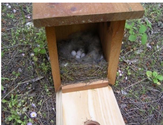
Foto 3.- Niu amb ous de ferrerico ( Parus major ). Son Real, 30/04/2009..