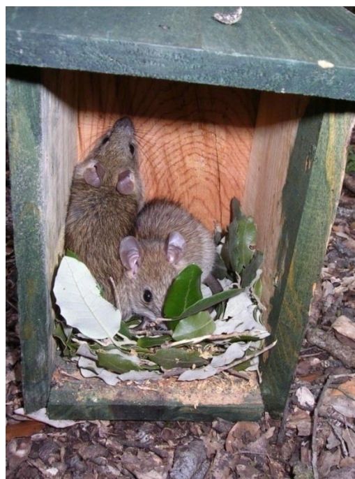
Foto 10.-Niu ocupat per rata negra ( Rattus rattus ). Defla, 04/2010