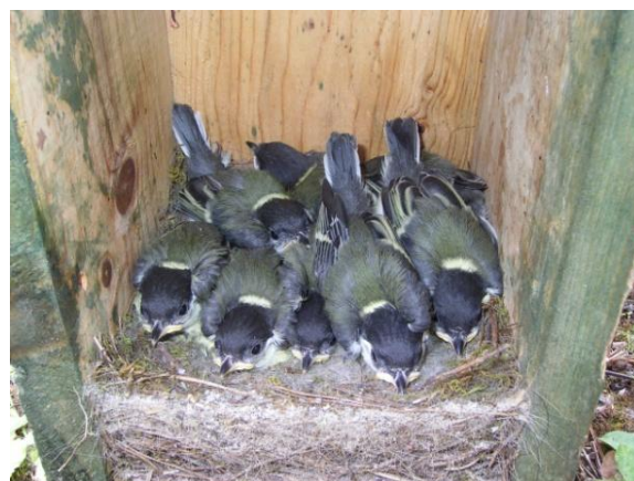
Foto 4.- Niu amb 8 polls de ferrerico a punt de volar (17 dies). Sineu, 02/06/2010.