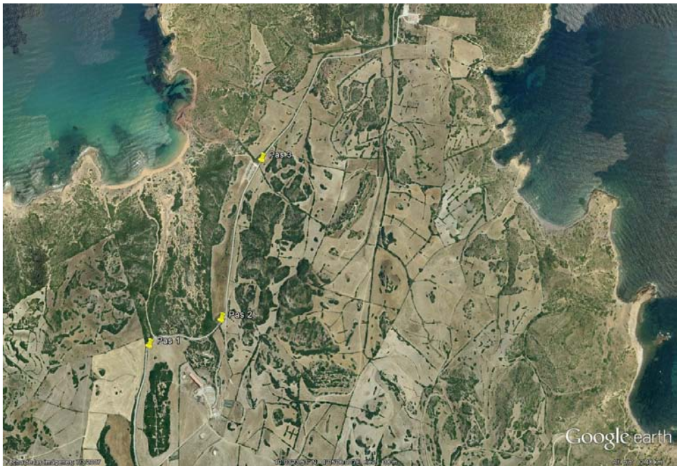
Fig. 2. Localització dels tres passos de bestiar de la carretera del cap de Cavalleria. Entre el primer i tercer hi ha una distància d'1 km.

Durant el període 2007-2010, es va realitzar un recorregut cada dos dies, visitant els tres passos de bestiar de la carretera que va al Cap de Cavalleria (Fig. 2) per observar la possible caiguda de fauna. El pas de bestiar 1 és el més proper a