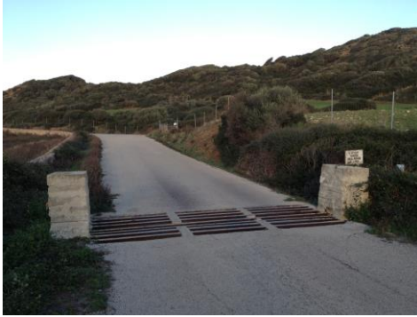
Fig. 3. Pas de bestiar 2.