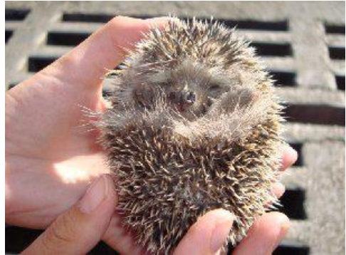
Fig. 5. Un eriçó juvenil sobre un altre mort, possiblement de sed (agost 2009).

Fig. 5. A young hedgehog on top of a dead one which was possibly due to lack of water (August 2009).