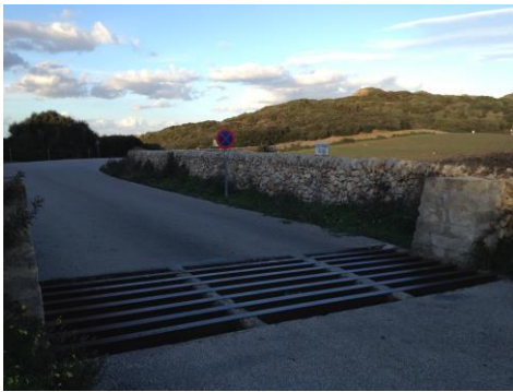
Fig. 1. Pas de bestiar 1, carretera del Cap de Cavalleria.

Els passos de bestiar consisteixen en una graella de barres o reixes metàl·liques paral·leles que s'instal·len en posició horitzontal i a nivell de rasant. Les barres se disposen de forma transversal a la direcció de la via. Sota la graella hi ha un petit fossat d'uns 30-90 cm de profunditat. Els animals eviten creuar sobre el pas canadenc en primer lloc perquè els provoca desconfiança i en segon perquè els resulta difícil fer-ho. Les potes dels animals de mida gran (vaques, cavalls) poden llenegar i això frena el seu trànsit.