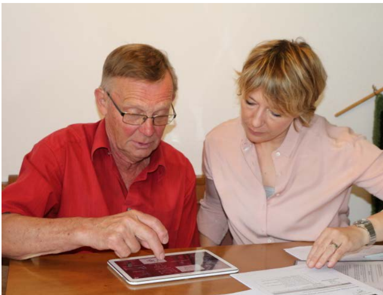
Ein Teilnehmer lernt unter Anleitung das elektr. Tagebuch kennen.