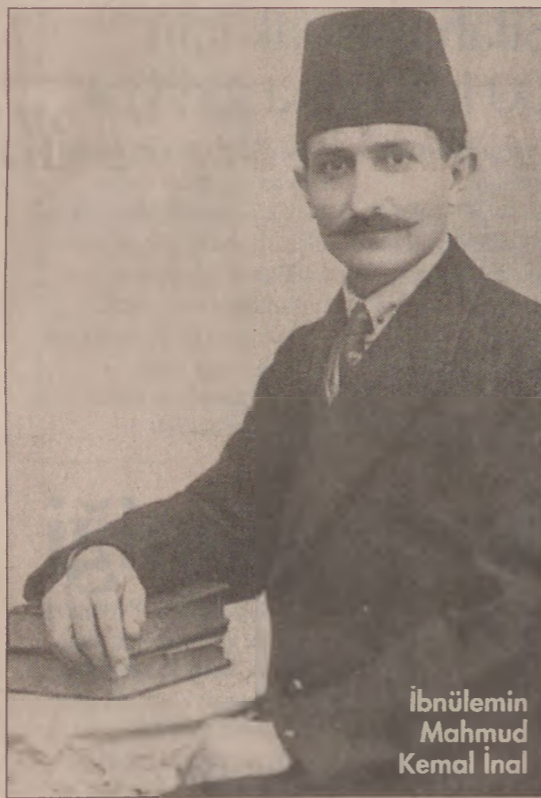
İbnülemin Mahmud Kemal İnal

birtakım kinyasal işlemlerden geçirdikten sonra 'pastırma' halini almakta ve zaman geçtikçe sertleşmektedir.