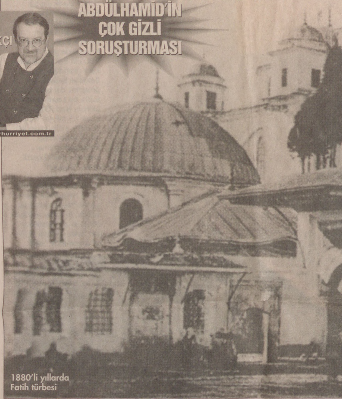
1880'li yıllarda Fatih türbesi