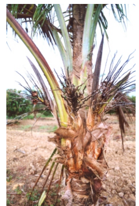
Fig. 3. Necrose de inflorescências, com secamento e queda de flores e frutos.

Os sintomas da murcha-de- Phytomonas manifestam-se primeiramente nas inflorescências, as quais são afetadas em diferentes estádios. Quando jovens e ainda fechadas, a necrose inicia-se na extremidade e avança para a base, tornando o tecido escuro e úmido, que exala um odor fétido. As inflorescências já abertas tornam-se necrosadas também a partir das extremidades (Fig. 3) e as flores, fecundadas ou não, secam e caem. Em plantas na