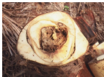
Fig. 6. Corte transversal do estipe, mostrando apodrecimento do meristema apical e de inflorescências.

secamento das folhas, a partir das mais velhas, que começam pelas extremidades e progridem no sentido ápice-base das folhas (Fig. 5). Nesse processo, freqüentemente verifica-se o secamento da flecha, devido à