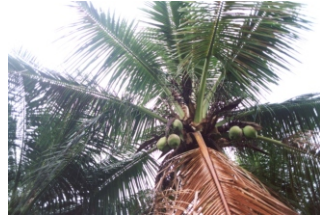
Fig. 4. Frutos desenvolvidos aderidos ao cacho.

fase inicial da doença, os frutos já desenvolvidos aparentemente não são afetados, permanecendo verdes e aderidos aos cachos (Fig. 4), enquanto os mais jovens secam e caem. Em seguida, ocorre o empardecimento e