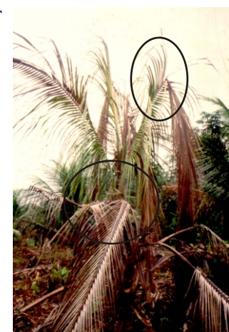
Fig. 7. Planta com secamento avançado da folhagem, mostrando ruptura das raquis na parte mediana ou proximal.