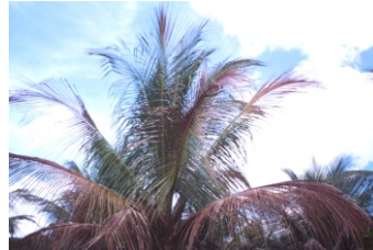
Fig. 5. Empardecimento e secamento ascendente de folhas.