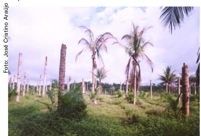
Fig. 2. Coqueiral destruído pela murcha-de- Phytomonas no município de Manaus - AM.