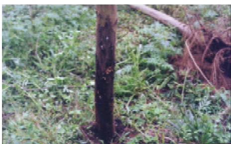
Figura 5 Lesão tipo GCT (gomose no colo e no tronco), iniciando no colo e se estendendo pelo tronco da árvore.

Tipo GCT (gomose no colo e no tronco): lesão tipo GC, iniciando no colo e se estendendo verticalmente no tronco. Às vezes, ocorre fendilhamento da casca. A lesão tipo GCT caracteriza-se por apresentar uma grande área escurecida na casca do tronco e abundante exsudação gomosa. Em condições propícias à doença, verifica-se acúmulo de grumos próximo ao colo, resultante de pedaços de goma com partículas de solo aderido. Em árvores com lesões velhas, o tamanho da lesão GCT é resultante da coalescência de lesões dos tipos GC e GT (Figura 5).