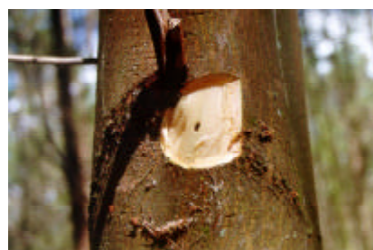
Figura 9 Galeria no tronco provocada pela broca.

Este inseto é caracterizado por fêmeas de cor marrom-escura e os machos pretos (Pedrosa-Macedo, 1993). Os danos desta praga constituem-se na abertura de uma rede de galerias, nos planos transversal e longitudinal ao tronco das árvores. Estas galerias, além de enfraquecer a sustentação da árvore, são portas de entrada de bactérias e fungos patogênicos causadores de diversas doenças.