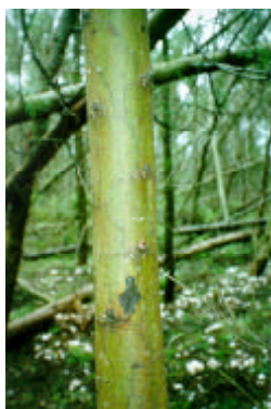
Figura 1 Lesão tipo M (mosqueado), sem exsudação de goma, em árvore de acácia-negra.

Tipo M (mosqueado): lesão necrótica na casca, de cor escura, formato irregular, mas alongando-se principalmente no sentido longitudinal do tronco, contrastando com a área verde do mesmo, localizada acima da região do colo e sem presença de exsudação gomosa. A característica principal desse sintoma é a ausência de exsudação. (Figura 1). Ao se retirar a casca, verifica-se, internamente, o escurecimento do lenho. Geralmente, a lesão é maior na casca do que na parte interna correspondente do lenho;