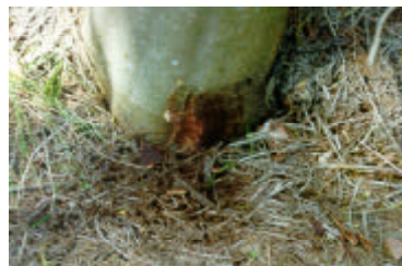
Figura 4 Lesão tipo GC (gomose no colo), na região do colo, em árvore de acácia-negra.

Tipo GC (gomose no colo): lesão necrótica na casca, de cor escura, com exsudação de goma, limitada à região do colo (nível do solo). A característica principal dessa lesão é a sua localização no colo (Figura 4). Às vezes, verifica-se abundante exsudação gomosa na superfície da casca afetada. A goma se acumula próximo ao tronco, na região do colo, formando grumos em contato com o solo. Internamente, ocorre o escurecimento do lenho. A lesão tipo GC é de difícil constatação nos seus estágios iniciais, em virtude de se localizar no nível do solo ou logo abaixo;