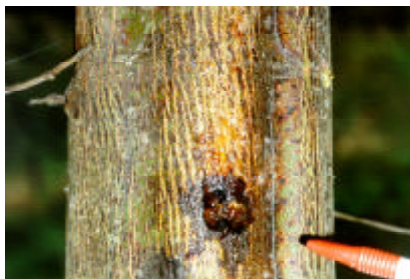
Figura 2 Lesão tipo GT (gomose no tronco), com exsudação de goma, em árvore de acácia-negra.

Tipo GT (gomose no tronco): lesão tipo M, com exsudação de goma. A característica principal dessa lesão é a abundante exsudação gomosa na superfície da casca afetada. (Figura 2). A goma escorre tronco abaixo, formando filetes e ocupando áreas maiores do que o tamanho real da casca afetada. As lesões são muito variáveis em tamanho e irregulares no formato (Figura 3). Em plantas mais velhas, essa lesão atinge grandes áreas do tronco, em virtude da coalescência de lesões;