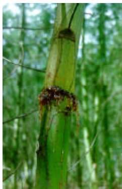
Figura 7 Exsudação de goma provocada pelo besouro serrador em tronco de acácia-negra.

O controle pode ser feito através da eliminação dos ramos cortados ou dependurados nas plantas e evitando-se, junto ao plantio, plantas nativas hospedeiras da praga. Outro método utilizado é a coleta de adultos através de frascos caça-moscas com orifícios maiores e contendo melão 10%.