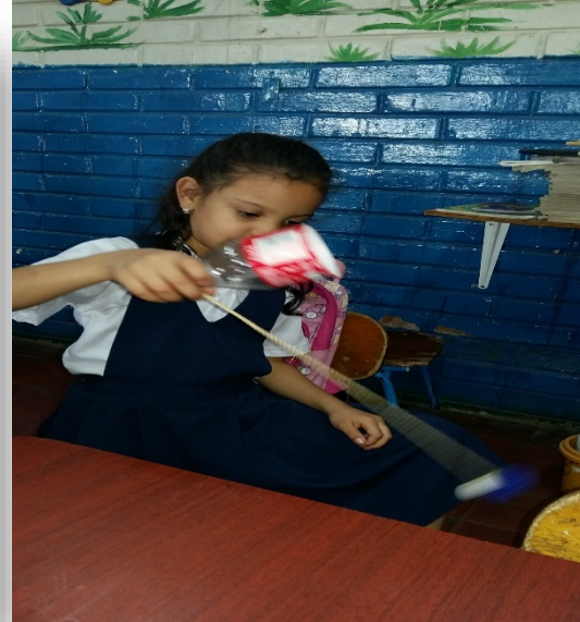
Niños y niñas participando en las diversas actividades de elaboracion de materiales didacticos