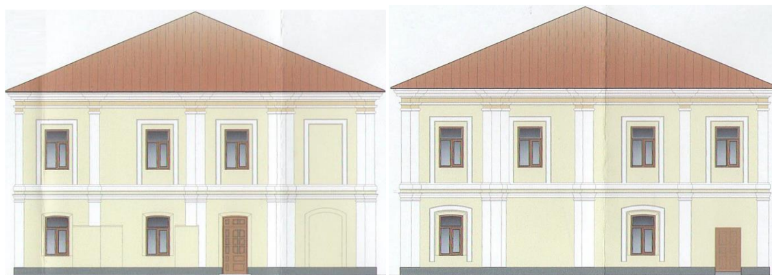
Західний фасад. Східний фасад.