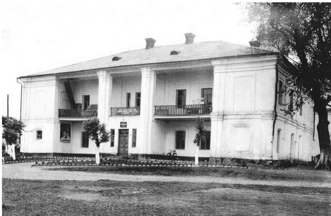
Рис.1. 1972 р.

пам'яток архітектури державного значення і через аварійний стан їх розібрали у 1990-х роках.