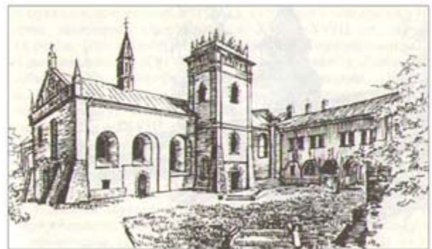
Монастир бернардинців у Луцьку (XVIII-XIX ст.)

Монастирі, розташовані в центральній частині старовинної забудови Луцька: