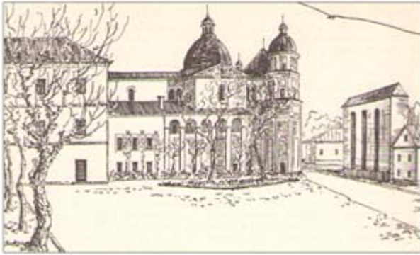
Монастир єзуїтів у Луцьку (XVII ст.)