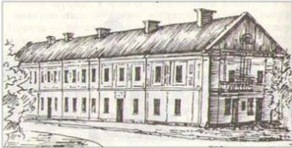
Монастир домініканців у Луцьку (XVIII ст.)

Залежно від своєї першочергової функції монастирі в Луцьку мають таке розташування: