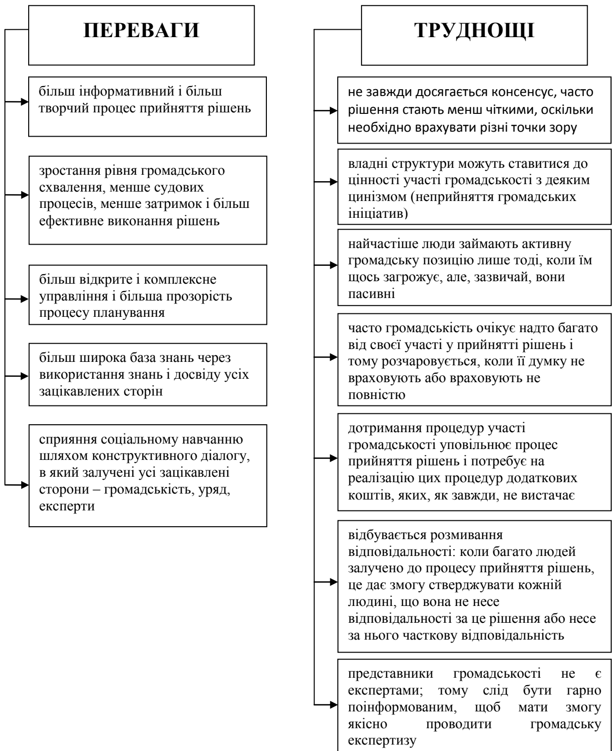
Рис. 3. Переваги та труднощі від участі громадськості у процесах прийняття рішень *Складено за [3, с. 140].