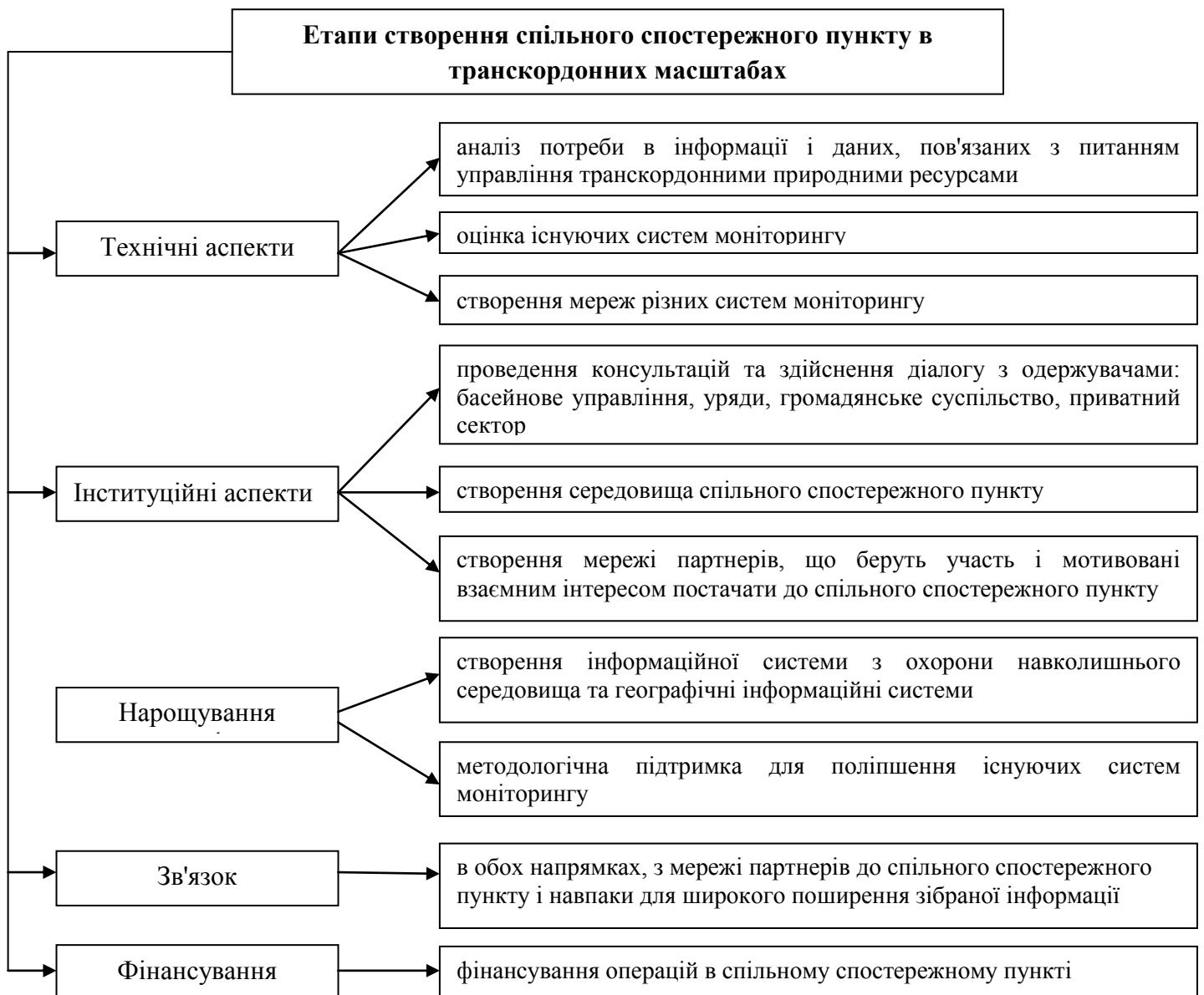
Рис.2. Етапи створення спільного спостережного пункту в транскордонних масштабах [Складено авторами]

управління та приймати спільні рішення. На рівні управління, спільні транскордонні органи відповідають за розробку інформаційної системи, здійснюють управління системою, відіграють роль посередника в робочих групах, створених для розробки і спільного використання узагальненої інформації. З технічної точки зору, інформаційна система повинна бути побудована, з метою, насамперед, полегшення доступу до інформації, корисної для прийняття рішень.