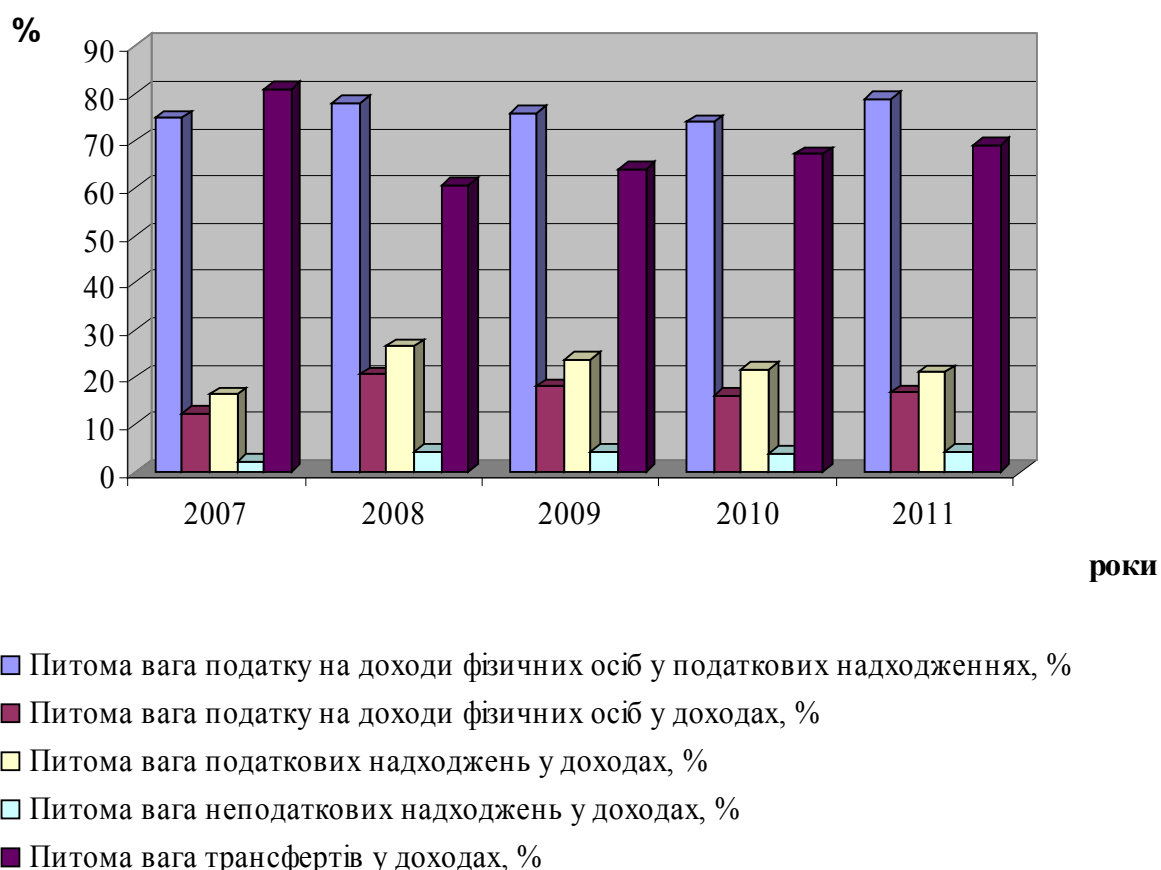
Рис. 1. Структура доходів бюджету Волинської області за 2001-2011 роки

Загалом в доходах зведеного бюджету області станом на 2011 рік частка податку на доходи склала 16,7%, тоді як надходження від усіх податків забезпечили формування 21,1% доходів. Питома вага податку з доходів фізичних осіб у середньому становила 22%, найбільше значення – 26,6% – спостерігалась у 2008 році, а найменше – 16,3% – у 2007 році. Значною і надалі залишається вага офіційних трансфертів області (69,1%), однак, в порівнянні з 2007 роком, коли їх частка становила 81,1% ситуація явно поліпшилась (рис.1.).