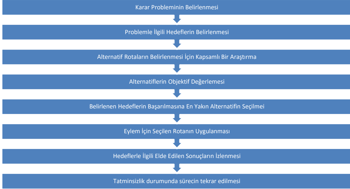
Şekil 1: Rasyonel Karar Verme Modeli