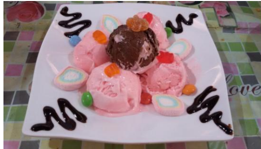
Gambar 2 Platter Sundae