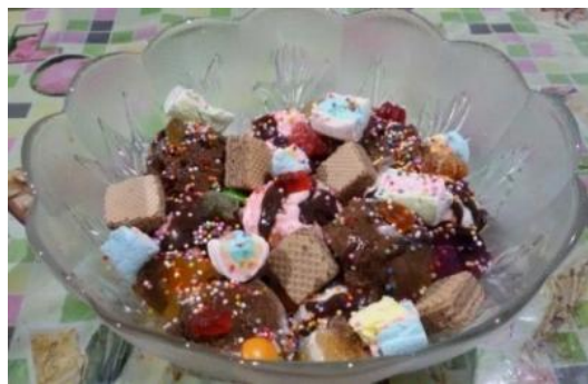
Gambar 1 KingKong Sundae