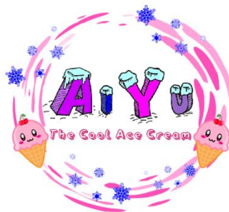
Gambar 6 Logo AiYu The Cool Ace Cream

Logo merupakan gambaran atau icon dari identitas suatu produk maupun perusahaan yang bersangkutan. Logo yang baik adalah yang dapat dikenali dengan baik, dapat menyampaikan makna yang sama untuk semua anggota target, dan dapat menimbulkan perasaan positif (Shimp, 2014). Berikut ini adalah logo dari AiYu The Cool Ace Cream :