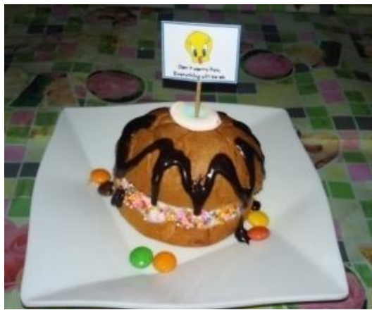
Gambar 5 Hamburger Sundae

Logo merupakan gambaran atau icon dari identitas suatu produk maupun perusahaan yang bersangkutan. Logo yang baik adalah yang dapat dikenali dengan baik, dapat menyampaikan makna yang sama untuk semua anggota target, dan dapat menimbulkan perasaan positif (Shimp, 2014). Berikut ini adalah logo dari AiYu The Cool Ace Cream :