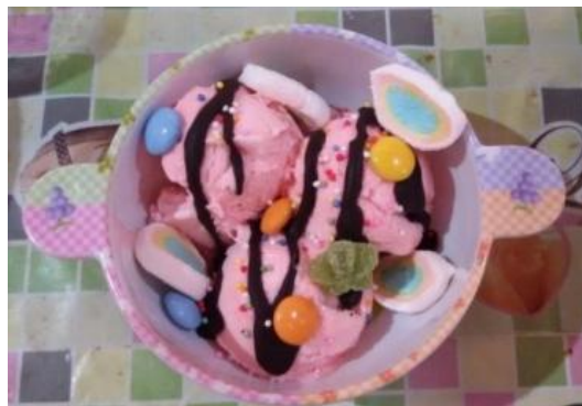
Gambar 3 Kid Sundae