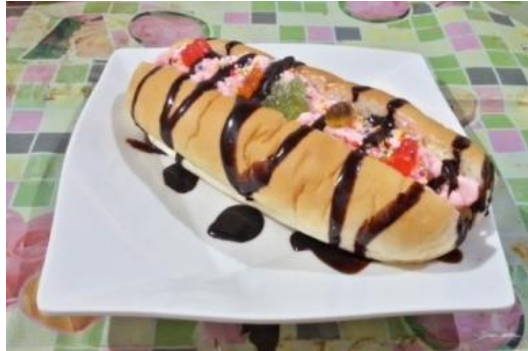
Gambar 4 Hotdog Sundae