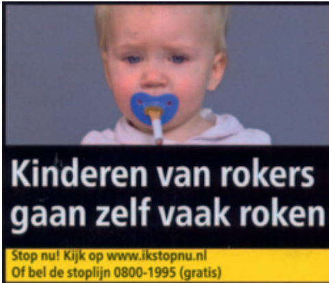
Figuur 1. Zien roken en meeroken doen roken (foto Robert van de Graaf).