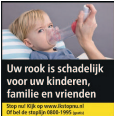
Figuur 2. Roken is een sociaal-netwerk probleem.

de kennis en attitude ten aanzien van het roken. Essentieel hierbij is dat ouders en leerkrachten zelf niet roken en dat er een tabaks-ontmoedigende rookvrije leef- en leeromgeving wordt gecreëerd. Als bijvoorbeeld rokende ouders zelf stoppen met roken dan is dat de beste manier om hun kinderen te beschermen tegen het roken. Daarmee hebben ze ook een protectieve invloed op de peergroep van hun kinderen en indirect dus ook weer op hun eigen kinderen. Naast het zelf stoppen met roken is het van belang dat ouders hun opvoedvaardigheden ten aanzien van het roken door hun kinderen gaan optimaliseren. Dit is zeker van belang als een kind al rookt. Ouders kunnen hiervoor hulp vragen bij de jeugdgezondheidszorg of verslavingszorg. Een goede afstemming met school en begeleiders bij vrijetijdsbesteding, zoals sportcoaches en sporttrainers is daarbij ook van belang. Zowel vanuit preventief als behandelooptpunt is het voor kinderen van belang dat er zoveel mogelijk één sociale ‘niet-roken’-norm en ‘niet-roken’-boodschap wordt uitgestraald binnen de omgeving waarin een kind zich ontwikkelt.