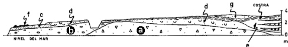
Fig. 2. Tall de Punta Roja segons de Butzer i Cuerda (1961). Escala vertical 3x. a- Bretxa. b- Conglomerat sub-arrodonit. c- Eolianita rosada. d- Platja i rere platja del MIS 5e amb una crosta a la part superior. e- Arenes llimoses amb lleties de graves. f- Conglomerats de platja del MIS 5a. g- Arenes sub-recents.

Els autors anteriors consideren el nivell a i el nivell b com a diferents. Vicens (2015) considera que no es veu tan clar la distinció entre els dos nivells i que podria