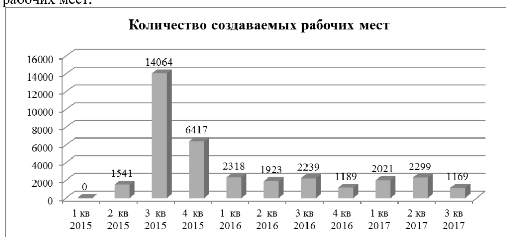
Р и с . 3. Количество создаваемых рабочих мест [7].

В целом за 2015–2016 гг. создано более 9000 новых рабочих мест, в т. ч: в 2015 г. – 2604; в 2016 г. – 6400 (рис. 3). Планируется создание 35908 новых рабочих мест.