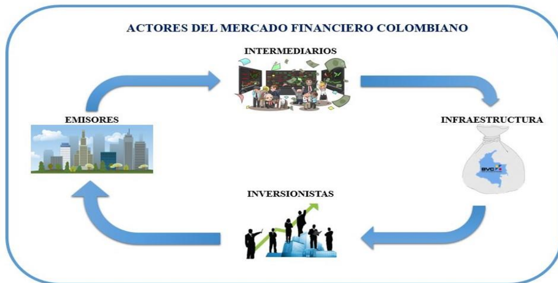
Gráfica No. 1 Actores del mercado Financiero Colombiano