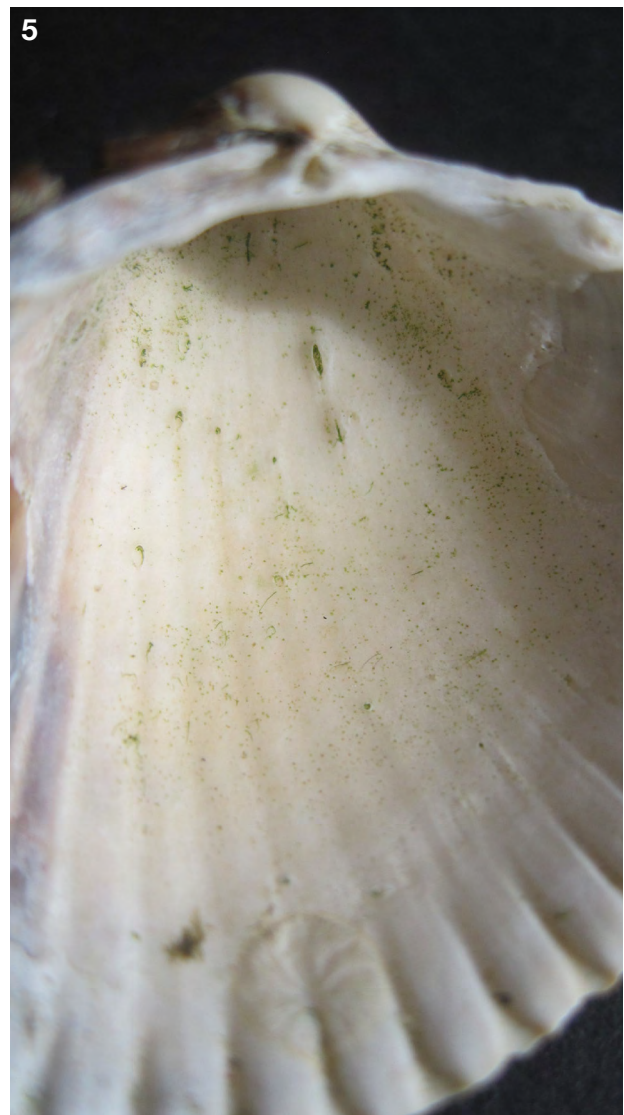
5. Trematode sporen bij Cerastoderma edule (Mokbaai Texel).

Bij Spisula solida vond ik een ander soort trematode(?) spoor dat leek op wat Bartoli (1976) beschreef bij Venerupis aureus . Bij deze tapijtschelp kruipen de trematoden die zich willen laten inkapselen nabij de siphonen in het schelpdier en vormen een blaas ter plekke van de mantelbocht. Iets dergelijks zag ik bij Sp. solida (fig. 6). Ik denk dat het ook een trematode is en mijn NIOZ collega David Thielges gespecialiseerd in parasieten onderzoek sprak dat niet tegen, maar zou natuurlijk levend materiaal moeten hebben om zeker te zijn. Dat laat ik graag over aan mijn collega's parasitologen op het NIOZ.