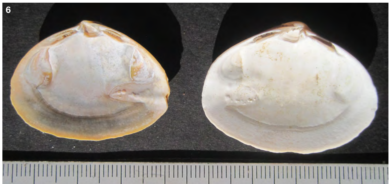
6. Trematode sporen bij Spisula solida (strand Hors Texel).