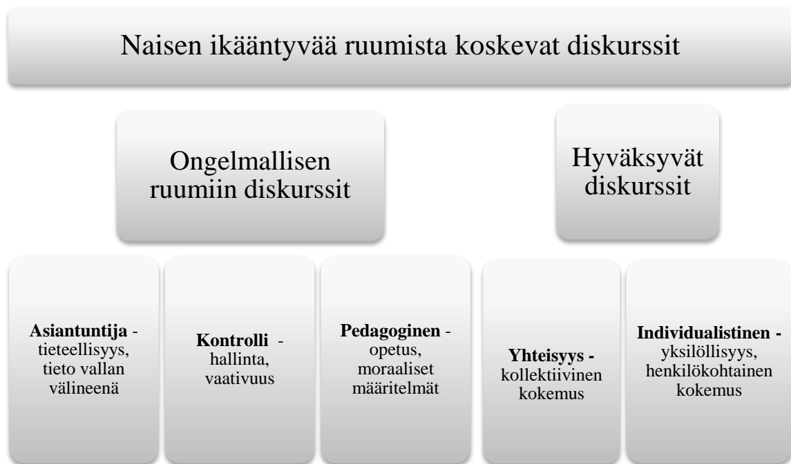
KUVIO 2. Diskurssien jaottelu suhteessa toisiinsa.

Nämä diskurssit voidaan luokitella niiden keskinäisten suhteiden perusteella osaksi kah- ta laajempaa metadiskurssia tai diskurssiryhmää (Kuvio 2.). Asiantuntijadiskurssi, kont- rollin diskurssi ja pedagoginen diskurssi edustavat puhetapaa, jossa keskeistä on ruu- miin muokkaaminen ja jossa ikääntyminen kuvautuu yleisesti ongelmallisena. Näitä ongelmallisen ruumiin diskursseja yhdistää ruumiin käsitteleminen ennen kaikkea ob- jektina. Yhteisyyden diskurssissa ja individualistisessa diskurssissa taas ruumista tarkas- tellaan sisältä käsin, subjektiivisen kokemuksen kautta ja ikääntymiseen suhtaudutaan näennäisen hyväksyvästi. Yhteisyyden diskurssi ja individualistinen diskurssi asettuvat siiis osaksi hyväksyvän ruumiillisuuden diskursseja .