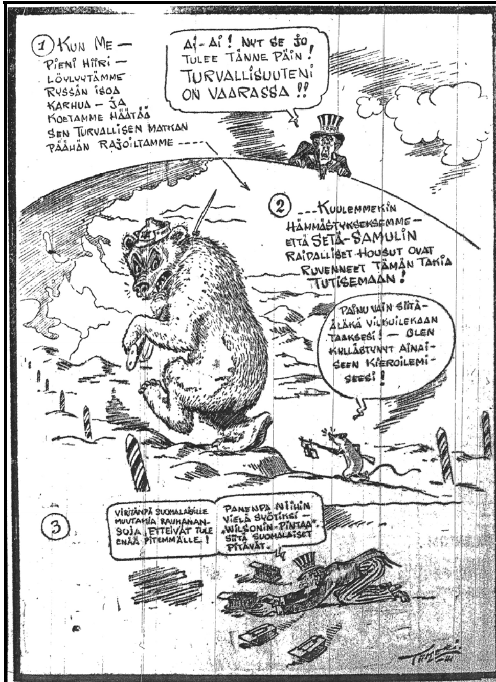
Tiikeri, Karj. 25.11.1941, s. 7.

Marraskuun lopulla Tiikeri ivasi Yhdysvaltojen vaatimuksia. Suomen ”hiiri” hätistää Venäjän Karhua kauemmas itään, ”setä-Samulin” katsellessa pelokkaana maapallon toisella laidalla.