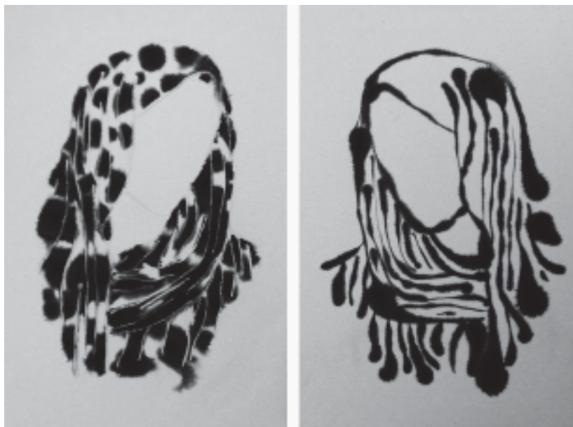
Deux Drapés (diptyque), 2006, 60 x 90 cm (dispersion de pigment sur toile).