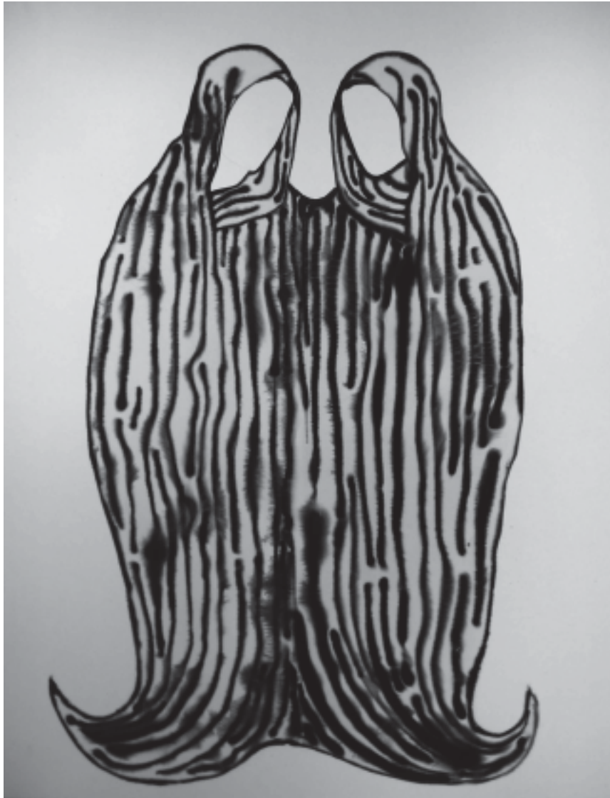
Saintes-Grenouilles , 2007, 213 x 168 cm (acrylique sur toile).