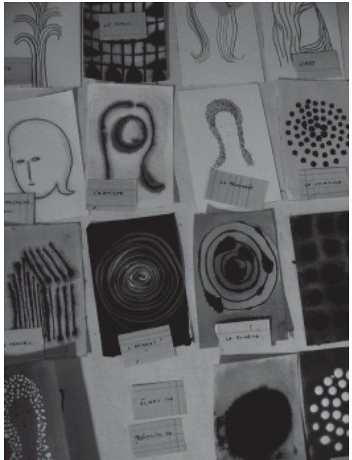
La Vie d'artiste , 2005, formats variés (encres sur papier).