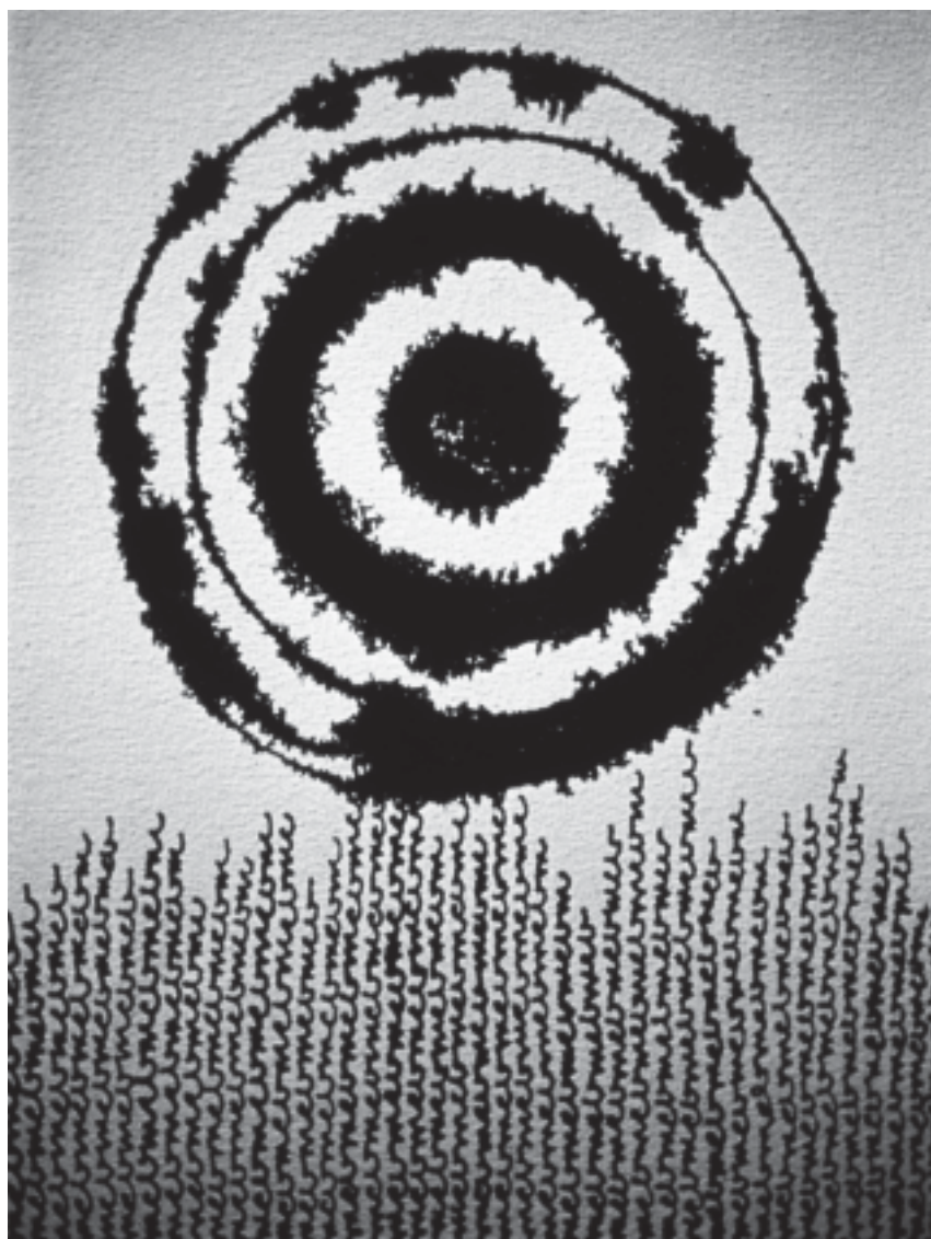
«mcb» petit soleil noir , 2004, 30 x 45 cm (encaustique sur toile et encre).