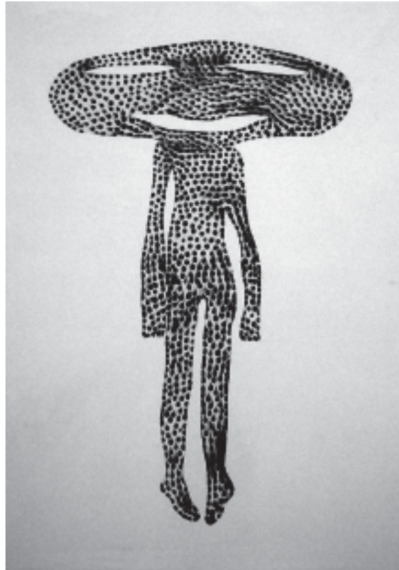
Grand Visage , 2004, 320 x 180 cm (dispersion de pigment sur toile).