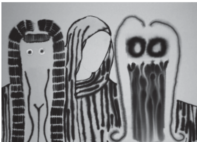
Trinité , 2007, 76 x 107 cm (acrylique sur toile).