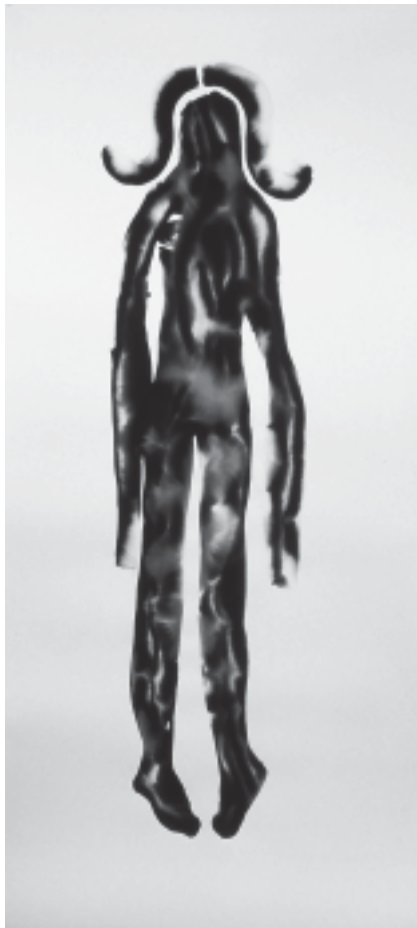
Grand bleu à cornes , 2004, 250 x 122 cm (dispersion de pigment sur papier).