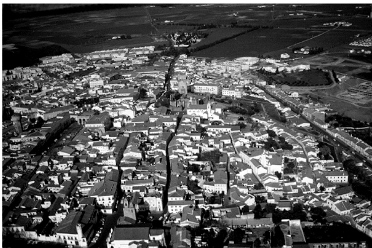
FIG. 1. ?????????? (falta legenda)

proporcionou à arqueologia emergir como determinante na reflexão sobre as condições de revitalização do centro histórico da cidade. (FIG.1)