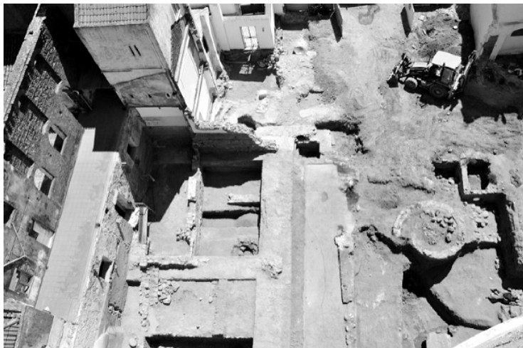
FIG. 5. ?????????? (falta legenda)

Arqueologia das cidades de Beja , previamente a uma análise detalhada e periodizada prefere assumir o carácter não determinante da cronologia para o conhecimento sobre o passado e aliviar o trabalho arqueológico dessa obsessão pelo pressuposto historicista e modernista que compartimenta o tempo em camadas empilhadas umas sobre as outras, correspondendo a cada uma delas a uma estrutura social e toma o tempo como medida valorativa, conferindo maior valor ao mais antigo. A paisagem urbana de Beja estrutura-se na herança de um povoado pré romano de dimensões largas ainda não definidas, na colónia romana de Pax Iulia e na destacada Beja medieval e moderna, sem que algum destes tempos se posicione mais importante.