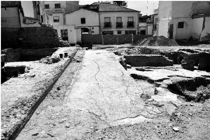
FIG. 6?. ?????????? (falta legenda)

Arqueologia das Cidades de Beja: onde a cidade se encontra com a sua construção não propõe o passado como cenário, desafia o presente a herdar o seu passado e a usar essa transmissão na sua construção.