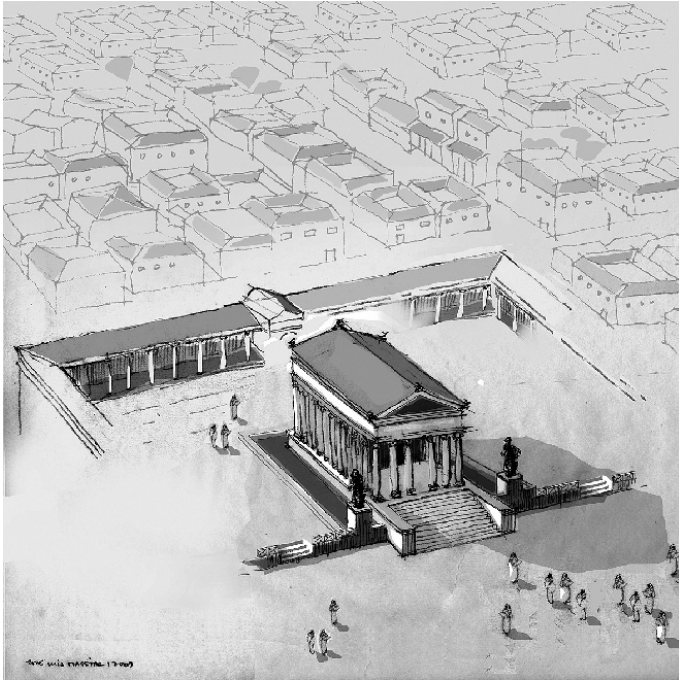
FIG. 3. ?????????? (falta legenda)