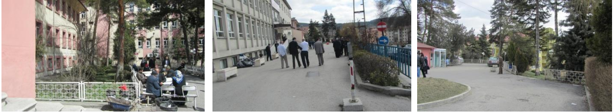
Şekil 4. Münif İslamoğlu Devlet Hastanesi bahçesinden görüntüler