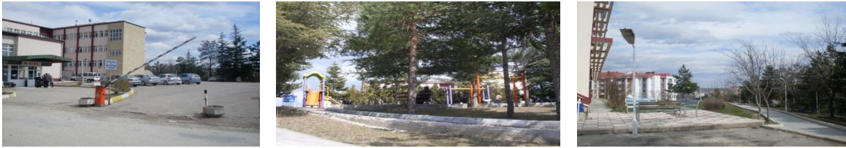
Şekil 2. Şerife Bacı Devlet Hastanesi bahçesinden görünüm