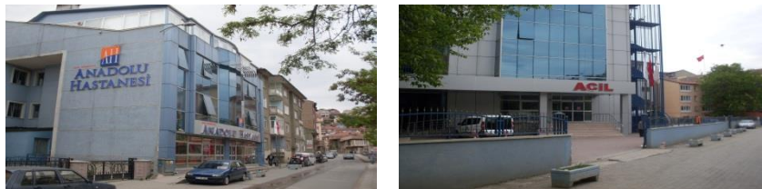
Şekil 6. Özel İsfendiyar Anadolu Hastanesi bahçesinden görüntüler