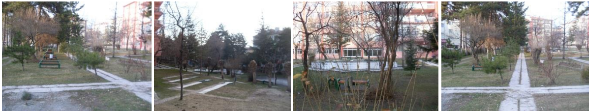
Şekil 3. Fizik tedavi ve rehabilitasyon merkezi bahçesinden görünüm