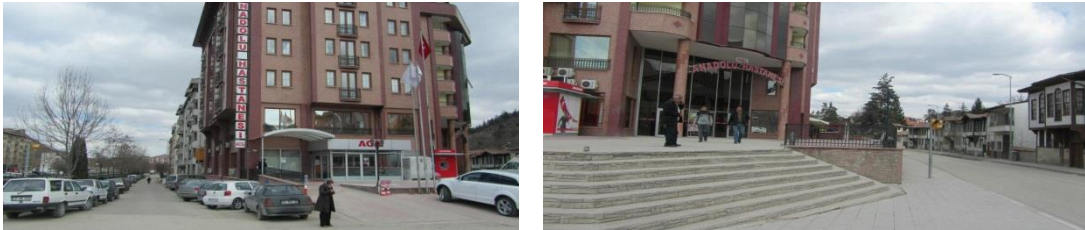
Şekil 5. Özel Anadolu Hastanesi bahçesinden görüntüler