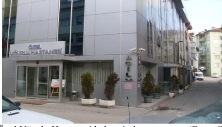
Şekil 7. Özel Uğurlu Hastanesi bahçesinden görünüm