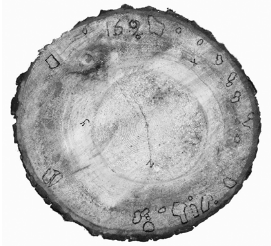
Şekil 2. H. annosum s.l.'un diri odundaki kolonizasyonu

Stereo-mikroskop altında yapılan incelemelerde, sadece 4. ve 8. ağaca ait diskler üzerinde, 18. numaralı ağacın 2, 3 ve 4. disklerinde, 19 numaralı ağaca ait disklerin tümünde ve 20 numaralı ağacın 2. diskinde H. annosum ' a ait konidiofor başlıklarına rastlanmamıştır (Çizelge 1).