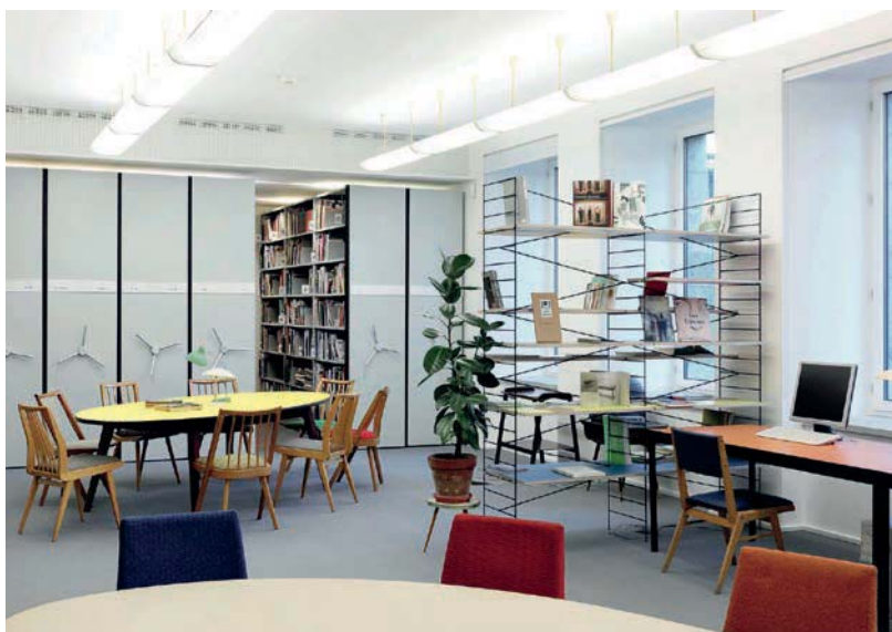
Abb. 2: Bibliothek der GfZK.

Themenbereiche Stadtentwicklung, Kunst im öffentlichen Raum, Kunstvermittlung und Kunstpädagogik sowie Literatur zu Kunst, Architektur und Design im 20. und 21. Jahrhundert. Der Inhalt des Bestandes orientiert sich am Ausstellungsprofil der GfZK. Der Präsenzbestand kann derzeit im Online-Katalog 5 recherchiert werden und ist ohne Anmeldung frei nutzbar. Ein kostenfreier WLAN-Zugang steht allen BesucherInnen zur Verfügung. Das Sächsische Ministerium für Wissenschaft und Kunst hat die Bibliothek als wissenschaftliche Spezialbibliothek anerkannt. Die NutzerInnen der Bibliothek sind v. a. Kunstinteressierte, im Kunstkontext Arbeitende sowie