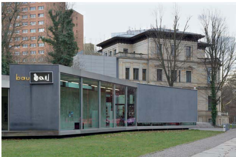
Abb. 1: Galerie für Zeitgenössische Kunst.

Die Kunstbibliothek ist eine feste Einrichtung innerhalb der GfZK. Der Auftrag und die Inhalte der Kunstbibliothek ergeben sich unmittelbar aus der Verortung sowie der inhaltlichen Auseinandersetzung mit aktuellen gesellschaftlichen Themen, die innerhalb der Institution diskutiert werden. Die Bibliothek ist öffentlich und kostenlos zugänglich. Ihr Bestand umfasst circa 20.000 Ausstellungskataloge, Künstlermonografien, Literatur zur Kunsttheorie, Kunstsoziologie, die