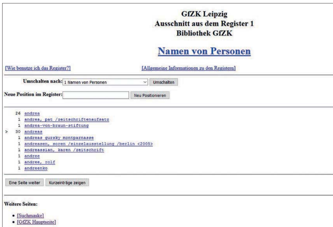
Abb. 3: WebOPAC der GfZK Bibliothek.

Studierende künstlerischer und interdisziplinärer Fachbereiche. Seit Ende des Jahres 2014 befindet sich die Bibliothek aufgrund ihrer Neuausrichtung im Umbruch. Ziel ist, die Bibliothek stärker mit den Aktivitäten des Museums, des Ausstellens, des Sammelns, des Vermittelns und des Forschens zu vernetzen.