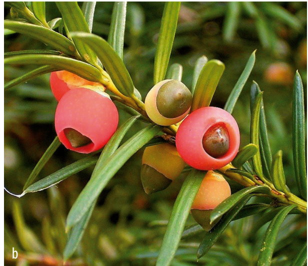
FIGUUR 2 Taxus baccata : (a) habitus; (b) vruchten.